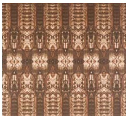
Cabinet de curiosité