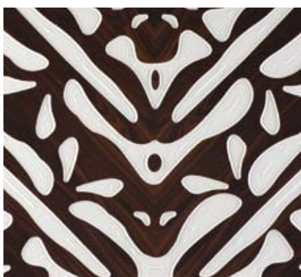
Passementerie de bois sur résine