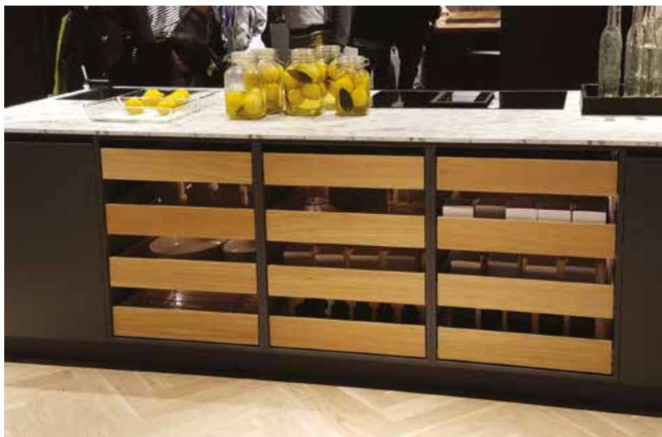
Új irányelv, a „nyitott” azaz fiókelő nélküli fiókok

Egy másik mamutcég (a mamut áraival) a Riva 1920. Ők Új-Zéland egykori mocsaraiból szállítanak gigászi méretű fákat. Elmondásuk szerint több ezer éves és a mocsár konzerválása miatt a még mindig élő törzseket vágják fel, amiből asztallapokat készítenek. A réseket víztiszta műgyantával kiöntik és tükörsimára polírozzák. Persze más bútorokat is készítenek, de mégiscsak az asztalaikra a legbüszkébbek. Egy barátom, aki náluk dolgozik elmesélte, hogy az első napon már voltak komoly érdeklődők ezekre az asztalokra, asztallapokra. Az asztallapok ára átlagosan 20 és 30.000 euró között mozgott, lábazat nélkül,