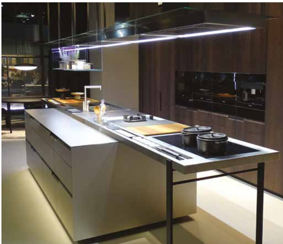
A Poliform "csoda" konyhája

Végül megemlítenék egy olyan konyhai kiegészítőt, ami egy érzékelővel ellátott eszköz, mely