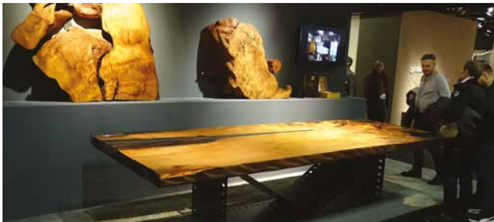
Egyedi megoldásokban nem volt hiány és az asztallapokat is meglepően magas áron kínálták