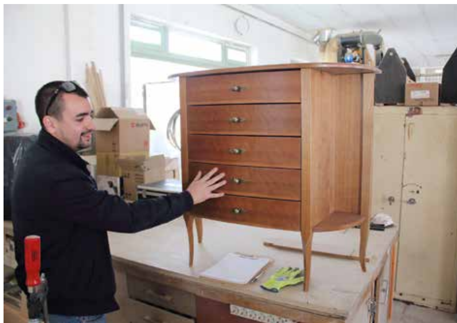
Készül az egyik tanuló vizsgamunkája

– (Hajdu Mihály) Művészi igényesség mindig is volt bennem, amit a belsőépítészeti munkáink során rendre formába is öntöttünk. Egyik kivételes példája ennek az Állami Számvevőszék konferenciatermének belsőépítészeti kialakítása. Sok más, kihívást jelentő munkát is készítettünk, mint pl. a Szabó Ervin Könyvtár vagy éppen a Miniszterelnöki Hivatal bebútorozása. Ezekre a mai napig büszke vagyok. Azonban a 3D-s megmunkálás felé mutató irányt a szükség teremtette.