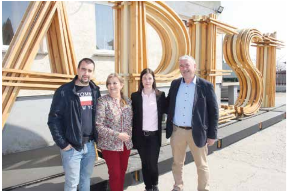
A Budapest felirat minden tavasszal a Hősök terén látható

– (Hajdu Ildikó) Én még a Budapest feliratot említeném meg. Erről a fabetűkből álló feliratról azt kell tudni, hogy a Hősök terén állítják fel minden évben, a Budapesti Tavasz Fesztivál ideje alatt. Ez volt