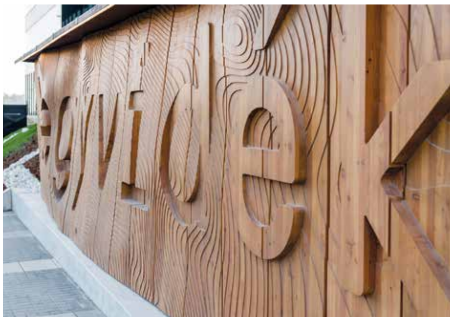
A Budán található Hegyvidék felirat közös projekt a Hello Wooddal