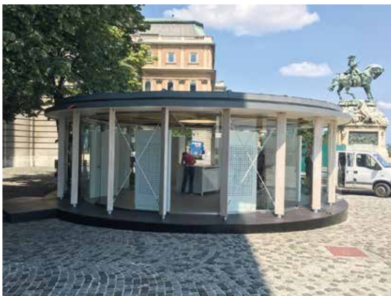
Ideiglenes kiállítóhely a Budai Várban