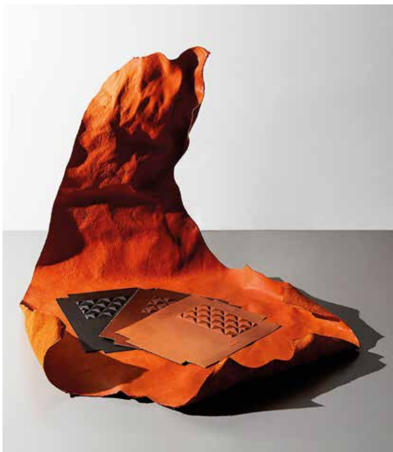
Kobe Leather bőrből készült ajándékok (Kuli-Kuli, Japán)

A bemutatott termékek általában konkrét vevői igényeket elégítenek ki, jól behatárolható funkciókkal. Sok terméknel a betöltött funkciók között ott szerepel a meghökkentés, az elgondolkodtatás.