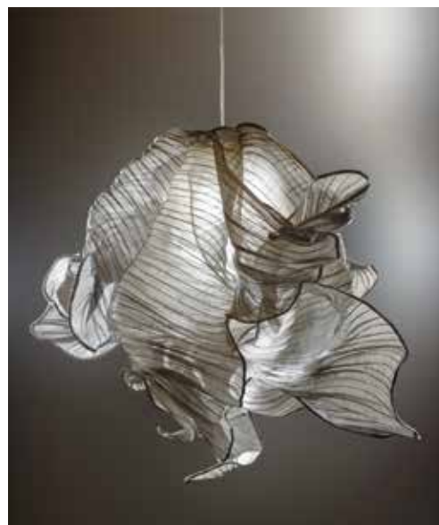
Nebula Lamp lámpa (Studiomirei, Olaszország) ( https://www.inexhibit.com , 2019.05.28)

Az esemény látogatása olyan tapasztalat, ahol nemcsak vizuális