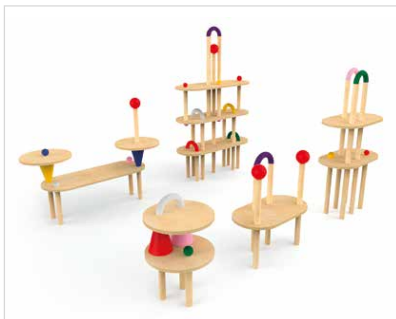
Koko Loko gyerekbútor (Koko, Horvátország)

pavilonjaiba ingyenes belépést biztosít. Az 5-ös kapu olyan pavilonokkal várja a közönséget, ahol a kiállítók kiérdemelték, hogy ott lehessenek, hogy tehetségüket megmutassák. Projektjeikkel új értékeket teremtve egy új jövőt alapoznak meg. Olyan jövőre gondolunk itt, amely nagy kihívásokat jelent a környezettudatosság