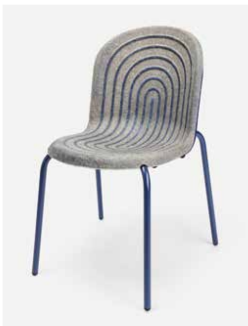
Halo szék (Studio Philipp Hainke, Németország)