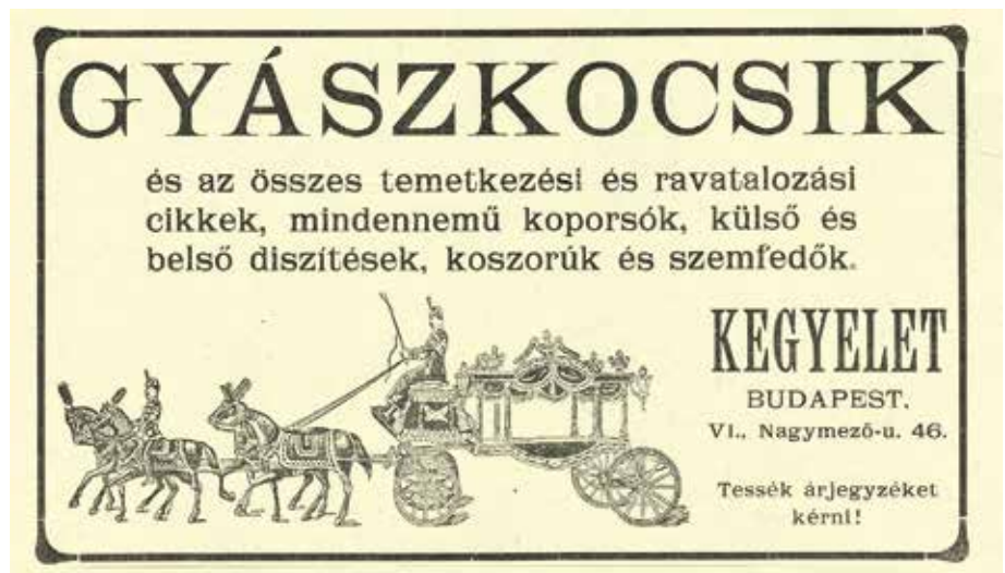
Pompás jármű az utolsó útra

Falemezgyár-Weinreich Frigyes, Szászrégen hirdetését is. Speciális területe az asztalosságban a kegyeleti eszközök, koporsók és egyéb temetési kellékek gyártása és forgalmazása. Ebben a témában 4 vállalkozás ajánlja szolgálatait.