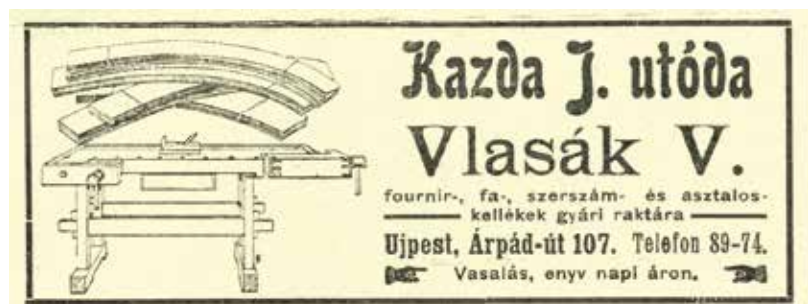
Szerszám- és kellékraktár Újpesten

A polgári lakások jellemző berendezéséhez tartoznak az étkezőgarnitúrák tálalószekrényei, hatalmas étkezőasztalai, dúsan faragott, gyakran bőrozott székei. Fontos megjegyezni ennek kapcsán, hogy a divatos, kevés faragvánnyal, de izgalmas furnérozással borított és kecses rézveretekkel felszerelt szecessziós bútorok mellett főleg nagypolgári körökben még igen elterjedt volt a dúsan faragott, plasztikus kialakítású historizáló neobarokk és ónémet bútorvilág. Mindegyik stílusirányzat használta a márványpultokat, ezért 4 olyan hirdetés is van az újságban, akik komplett csiszolt márványelemeket, szükség esetén márvány- és egyéb nemeskő mozaikot is készítenek. Természetesen az üveg és a tükör legalább olyan fontos volt ebben az időszakban, mint a nemes kövek.