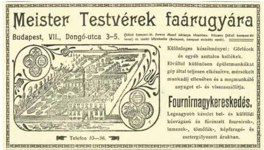
Nagy kereslet, nagy gyár

Ennek megfelelően 8 olyan hirdetés is található, ahol üveglapok, csiszolt, hajlított, fémkeretbe foglalt, festett bútörüveg alkatrészeket és tükrök számtalan változatát kínálják. Bár ebben a korban már voltak komplex faipari gépmunkákat vállaló asztalosüzemek, ugyanakkor a finom munkákat, az összeépítést és a felületkezelést többnyire kéziszerszámokkal, egyszerű körülmények között, gyalupadokkal felszerelt hagyományos műhelyekben végezték. Ennek megfelelően 6 olyan kereskedő is hirdet az újságban, akik főleg kéziszerszámokat és kis műhelyek felszerelését kínálják. Kiemelkedik közülük az a Kiss Ernő és Társa, akik túlélve gazdasági válságokat és világháborúkat, egészen az 1948-as államosításig működtek és közel 50 katalógusuk jelent meg asztalos szerszámokat és vasalatokat kínálva. Ebben az időszakban már használtak fényes festékeket, zománcokat és nitrolakkot, ugyanakkor a nemesebb, igényesebb bútoroknál előnyben részesítették a hagyományos magas fényt adó, de sok hozzáértő kézi munkát igénylő sellakpolitúrozást. Ennek ellátását 3 kereskedő hirdetései biztosították. Speciális terület a bútörvasalat: ezt az újságban 4 cég hirdetése is kínálja a legmodernebb, divatos és megbízható kivitelben. Bár a hirdetőik zöme budapesti és környéki, ugyanakkor találunk német bútör szállítót és az Első Erdélyi Bútör léc- és Fűrészelt