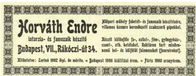
Ismét intarzia különleges anyagokkal

ma), de a telefonszámok nagysága jelzi, hogy még nem minden lakás tartozéka.