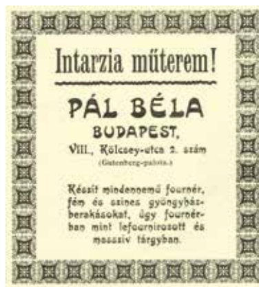
Divatos az intarzia