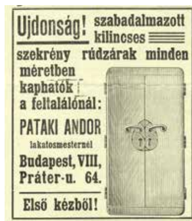
Speciális rúdzárak, esztétikus kivitel