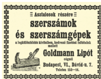
Szerszámából sosem elég

70 kisebb-nagyobb hirdetés elemzése. A reklámok ¾-része alapanyagot, segédanyagot vagy szolgáltatást kínál. 16 hirdetésben ajánlanak gépeket, gépi szerszámokat, illetve meghajtó motorokat. (Erről részletesen a következő lapszámban írunk.) Feltehetően a faipari üzemek, gyárak egyre növekvő száma miatt két olyan „mérnöki iroda” is megjelenik hirdetőként, akik komplett faipari üzemek technológiai tervezését és teljes gépesítését ajánlják. Az alapanyag-hirdetések között viszonylag kevés (3) a pusztán fűrészárut, faanyagot kínáló telep. Ennek feltehetően az az oka, hogy a legtöbb