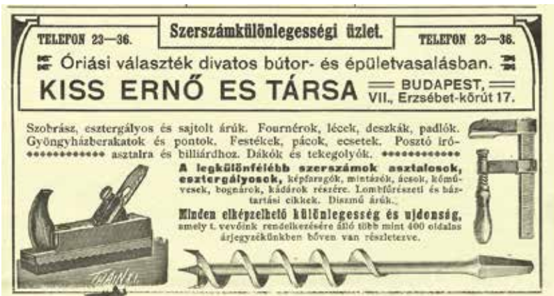
Korának egyik legismertebb szerszámkereskedője