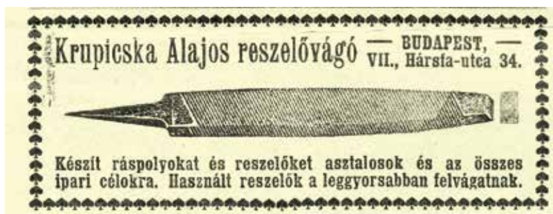
Egy különleges szakma

Bár az újságban hirdető gyártókon és kereskedőkön túl több száz hasonló profilú vállalkozó működött ebben az időben a területen, a hirdetések elemzése mégis teljes képet mutat a több, mint 100 évvel ezelőtti asztalosság izgalmás, átalakuló világáról. ■