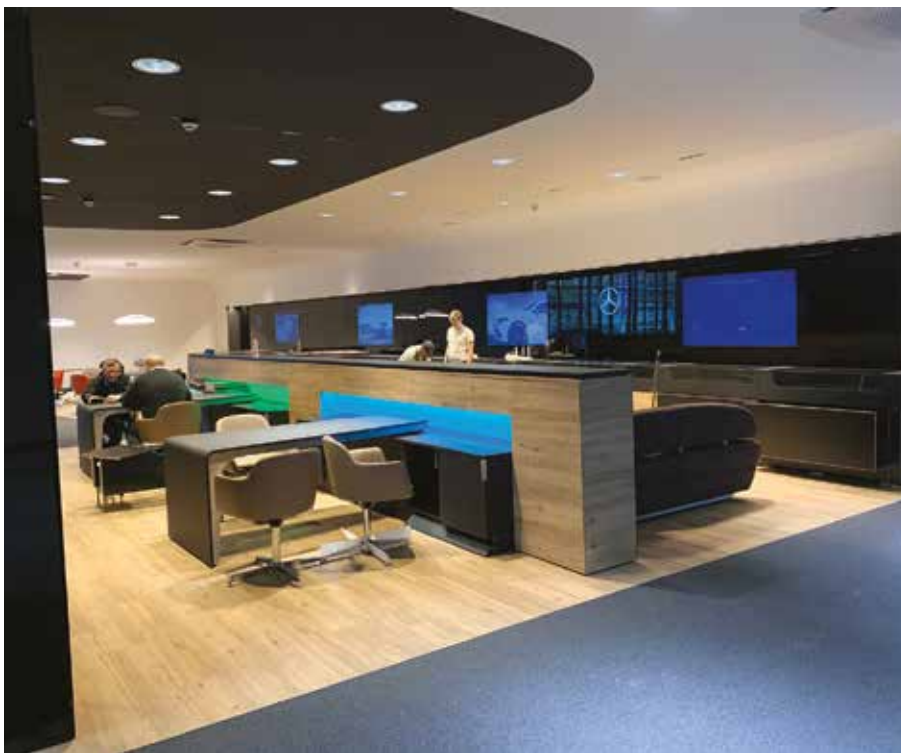
A Mercedes-Benz autók németországi szalonbútorai is itt készülnek

magyar gyártó áll mögötte, azonnal az alkudozások felé ment el a tárgyalás, sajnos.