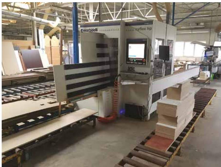
A furatolásokat álló CNC végzi

az üzletberendezési bútorokra érkező megrendeléseink pedig a világ minden tájáról érkeznek. S itt máris fellelhető az, ami nekem nem illett bele a képbe. Az irodabútorokban nincsen túl sok szakmai kihívás, ezt azért kijelenthetjük. Az üzletberendezéseknél pedig, bár nagyon sokat tanultunk a külsős tervezők egyedi formavilágát tükröző bútorok legyártása kapcsán, a szerepünk mégiscsak a bér munkás szintjén mozgott. Ennek a felismerése vezetett engem arra, hogy végre a saját ál munk megvalósítása érdekében is tegyünk valamit. A saját bútoraink formavilágába olyan újdonságokat szerettünk volna beletenni, ami egyrészt vonzó a vevőknek, másrészt ne legyen könnyen másolható. Így született meg a ukitchen.eu (your kitchen, azaz te konyhád – a szerk.) névre hallgató, prémium kategóriás lakossági konyhabútor család. Bár itt a vevő óriási szabadsággal rendelkezik a méretek, színek, alapanyagok kiválasztásánál, mi mégis szériában tudjuk mindezt