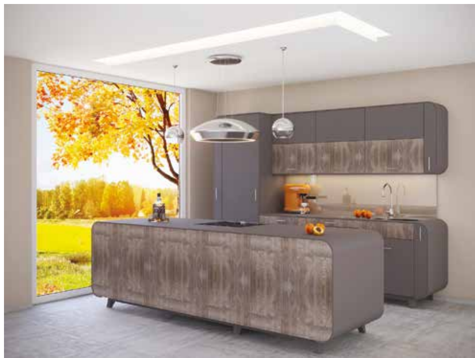
Az íves kialakítású jellegzetes konyhabútort két szabadalom is védi

– Mi egy irodabútorokat, üzleti berendezéseket gyártó 50 fős kisüzem vagyunk. Ez számomra pont az a méret, amit túlzott idegeskedések nélkül is el lehet irányítani, úgy, hogy még nem megy a magánéletem rovására. Ugyanakkor mindig arra voltunk és vagyunk büszkék, hogy rugalmasak tudunk lenni a bútorgyártói piacon. Rendelkezünk szériagyártó sorral, de mellette ott van az egyedibútor-gyártásra kialakított gépsorunk is. Vállalunk tömeges ajtófrontfestést, ugyanakkor például egyedi méretű és formájú corian pulttetőt is tudunk hajlítani. Ami pedig a munkáinkat illeti: irodabútorokat főként a magyar államigazgatás részére gyártunk,