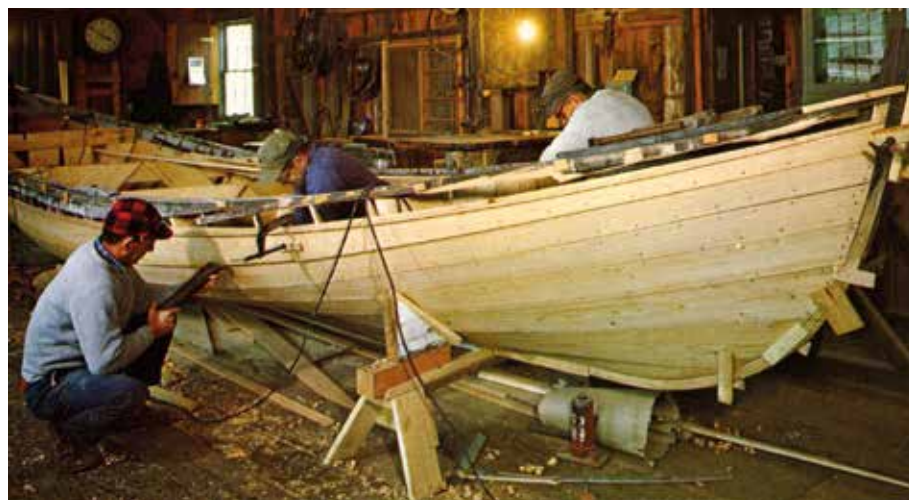
Hagyományos hajó építése – Connecticut

éves hagyományos formát ugyanúgy néhány célszerűen kialakított szerzővel minden előrajzolás nélkül