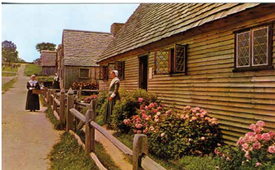
Hagyományos európai jellegű település – Massachusetts