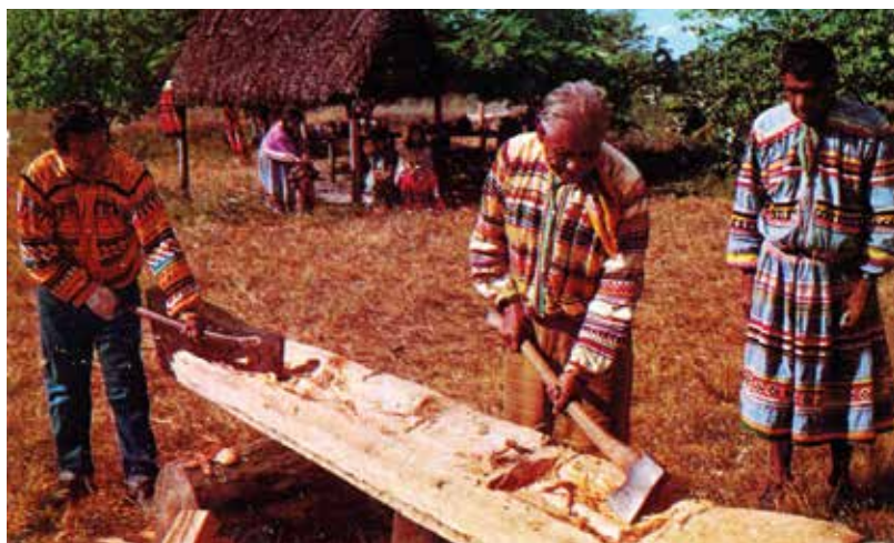
Hagyományos indián kenu készítése – Florida, 1959