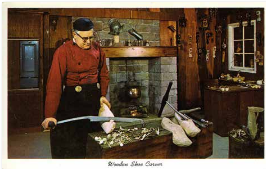
Wooden Shoe Carver

A korábbi századok folyamán az eredetileg sokmillió, és egész Észak-Amerikát benépesítő indián törzseket jórészt kiirtották, majd a XIX. század során a maradékukat rezervátumokba zárták. Az ide zárt lakosság igyekezett kulturális hagyományyaiból, öltözködési és viselkedéskultúrájából minél többet megőrizni. Tárgyaik készítéséhez az indiánok csak a környezetükben fellelhető anyagokat, igen gyakran fát használtak. A totemoszloptól a fakanálíig a mai napig őrzik a klasszikus formákat, és részben saját használatra, részben pedig a turistáknak ajándék céljából készítenek ilyeneket. Talán az egyik leglátványosabb ilyen eszköz egy több méter hosszú, egyetlen fatörzsből készített indián kenu. A több ezer