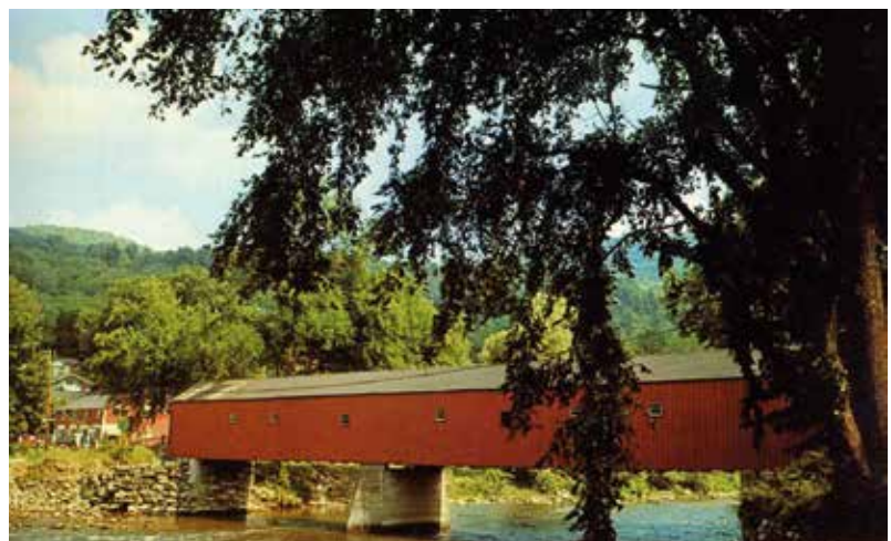
Fedett híd – Connecticut