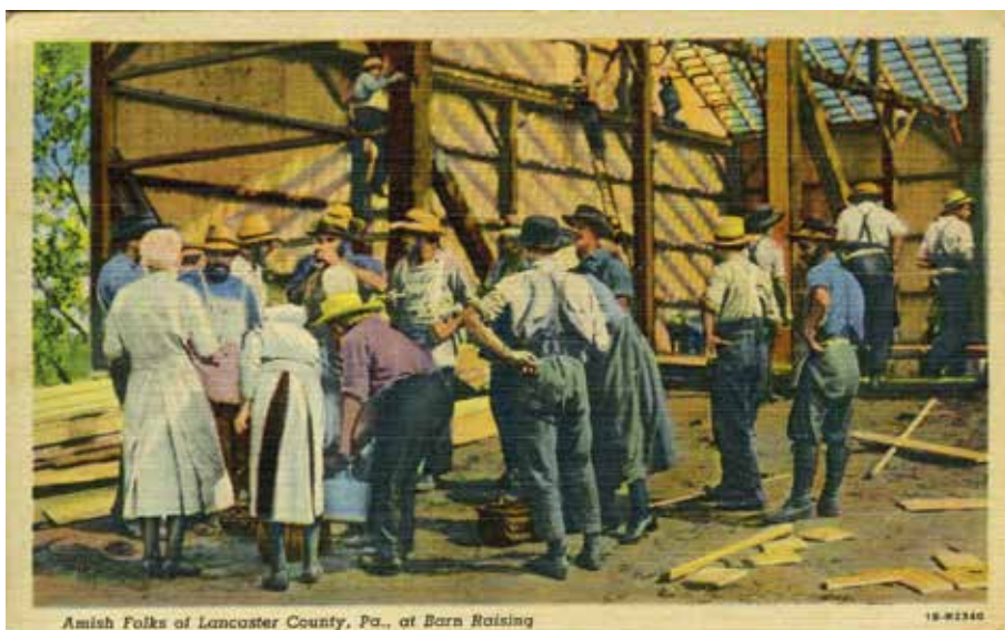
Házépítés az amishoknál – festmény