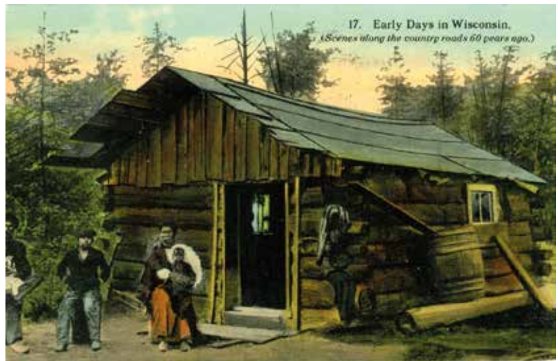
Régi boronaház – Wisconsin-Képeslap 1912-ből

A zömmel Európából induló több bevándorlási hullám sok tíz millió embert juttatott a jobb élet reményében az Újvilágba. A korábban tengerparton élő emberek hozták magukkal a hajós- vagy halászszakmájukat és hajóépítő tudásukat. A jó minőségű