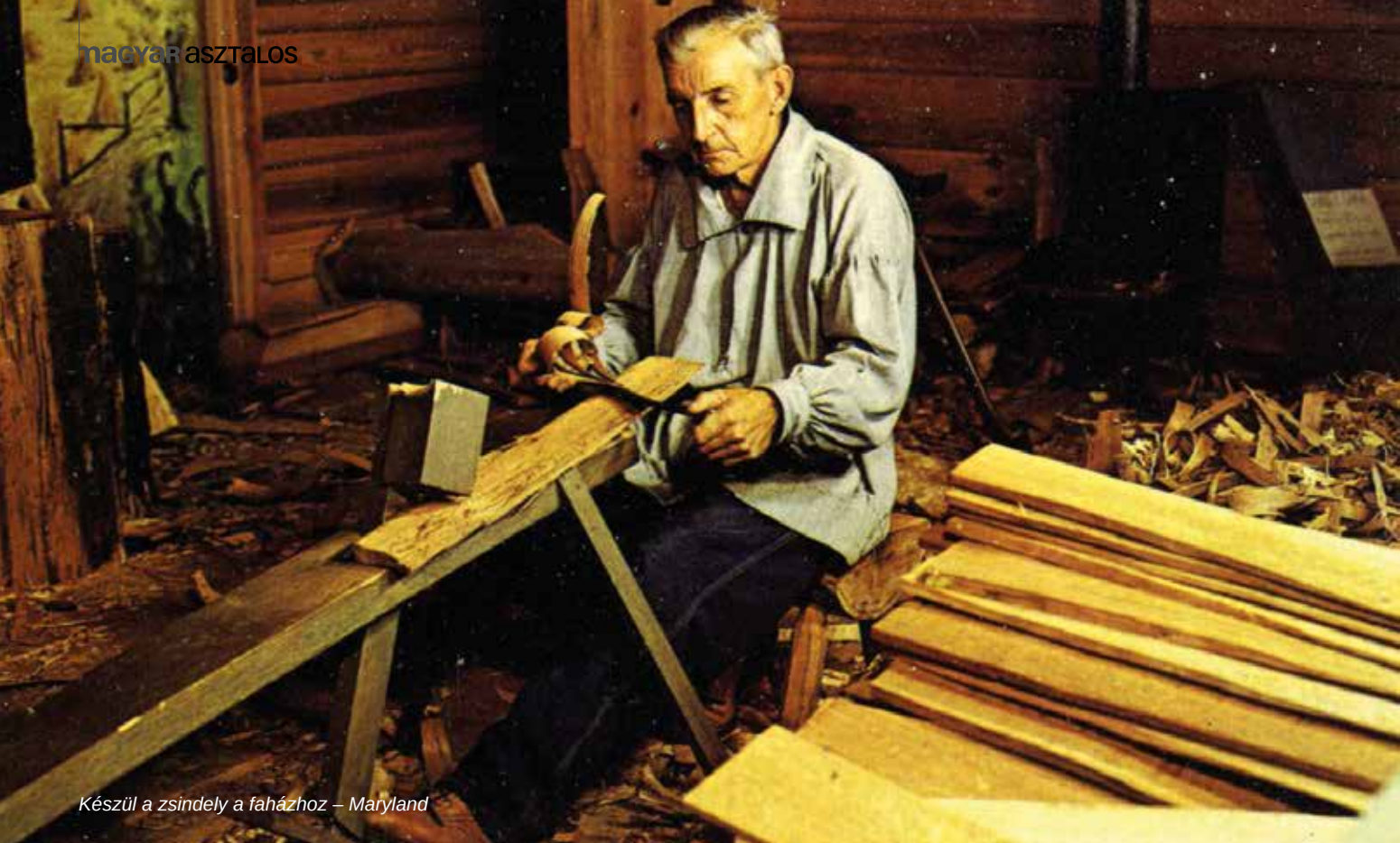
Készül a zsindely a faházhoz – Maryland