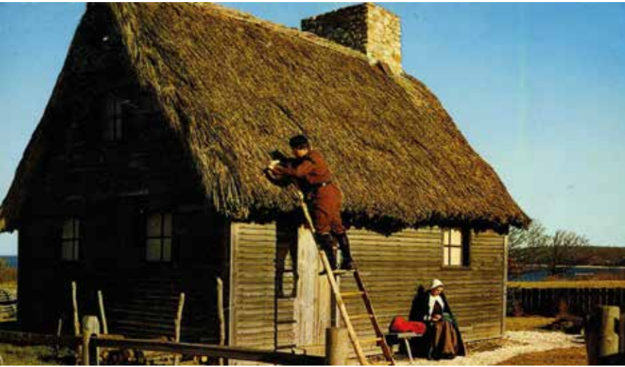
Múzeumi faház zsúptetejének javítása – Massachusetts

Ezeknek a járműveknek különleges és egyedi a vasalatrendszere, ezért nagyon gondosan őrzik a hagyományos tűzi kovácsműhelyekben a szerszámokat és a formamintákat. Bár nagyon egyszerű és dísztelen a lovak felszerszámozása, de a hagyományos bőrmegmunkálás, a szíj- és a nyeregkészítés ősi technikáit segít megőrizni.