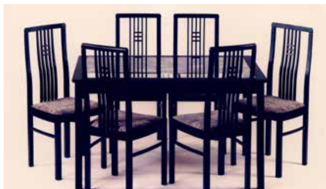
Flóra ebédlőszék és üveglapos-farácsos asztal. Gyártó: Balaton Bútorgyár, 1985.

partner a Magyar Bútor és Faipari Szövetség. Támogató a Magyar Formatervezési Tanács és a Design Hét Budapest. A kiállítás megrendezését a Magyar Művészeti Akadémia programpályázata támogatja. ■