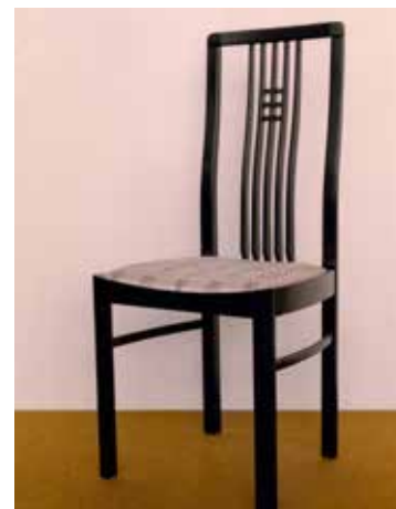
Flóra ebédlőszék. Gyártó: Balaton Bútorgyár, 1985.