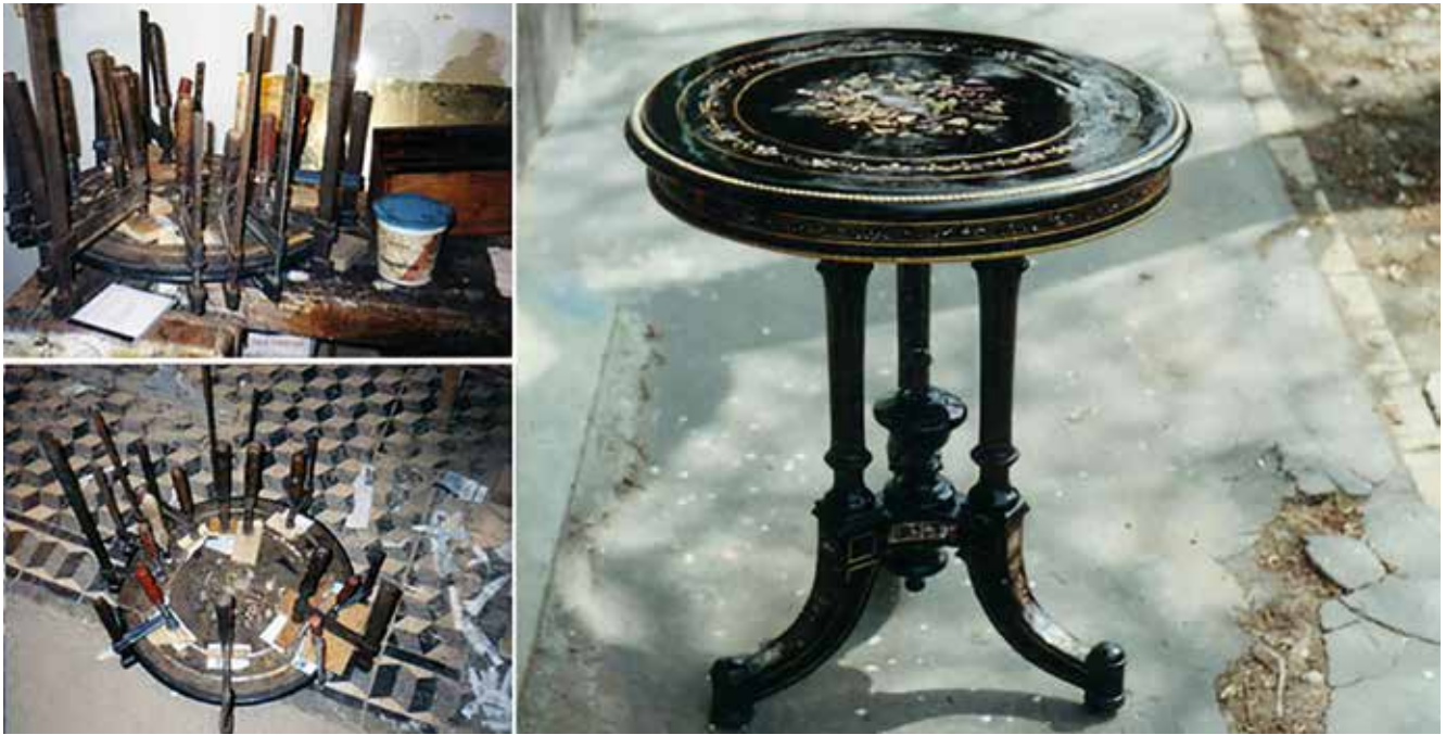
Bull asztalka munka közben és készen