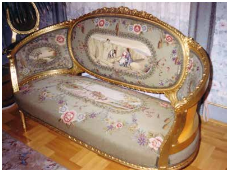
Őstechnikával aranyozott ülőke

jelölt területeket: a javítás során alkalmazott munkafolyamatokat, a felújítás során alkalmazott technológiát, a felhasználható alapanyagokat, vegyszereket, felületkezelő anyagokat, és egy körülbelüli költségvetést. Majd a munkálatok jóváhagyását követően első körben szükséges beszerezni azon alapanyagokat, melyek segítségével az eredeti állapotnak megfelelő minőségű restaurálást el tudjuk végezni rajta. A restaurációs munkálatok mindig egy alapos bútortisztítással kezdődnek, amely akár az antik bútor szétszedésével is járhat. A tisztítási folyamat végén