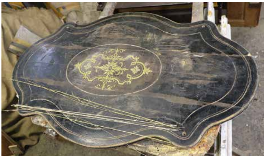
Bull asztal munka közben

A rézbetéteket úgy pótolják, hogy pauszpapírra lemásolják a mintát, amit indigóval a rézlemezre rajzolnak és gépi lombfűrésszel kivágják, majd túreszelővel a sorját lereszelik.