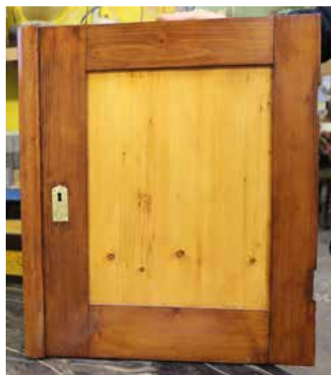
Kontár munkával átfestett szekrény és a minta, amilyen lesz, ha visszaállítják eredeti állapotába

látszik teljes bizonyossággal, hogy mely pontokon szükséges a bútör helyreállítása: a sérülések, hibák javítása, a kitört, hiányzó alkatrészek pótlása. Második lépésként fontos a nem éppen szakszerűen alkalmazott alapanyagok és felületkezelő anyagok eltávolítása, ügyelve arra, hogy az eredeti mester által használt anyagokat ne sértsük, illetve – lehetőség szerint – abból minél többet megőrizzünk, felhasználjunk a helyreállítás során. Elengedhetetlen munkafolyamat a javítandó munkadarab farontó bogaraktól való konzerválása, és