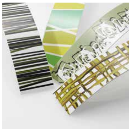
Fenntartható élzárók: RAUKANTEX pro ajtók élzárásához. RAUKANTEX eco és evo