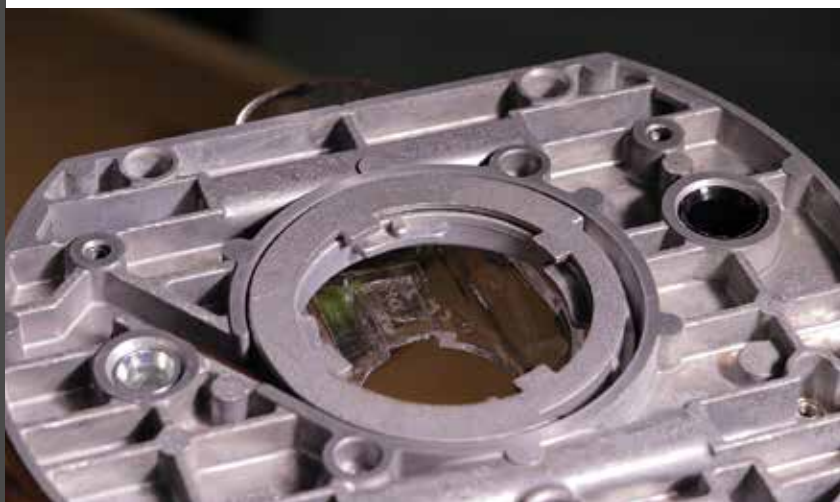
Kicsit szétszedtem, talán nem derül ki...