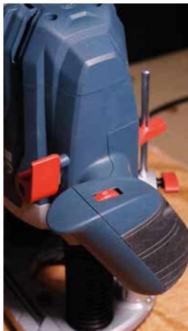
A biztosító kart lefelé nyomva oldódik a rögzítés.