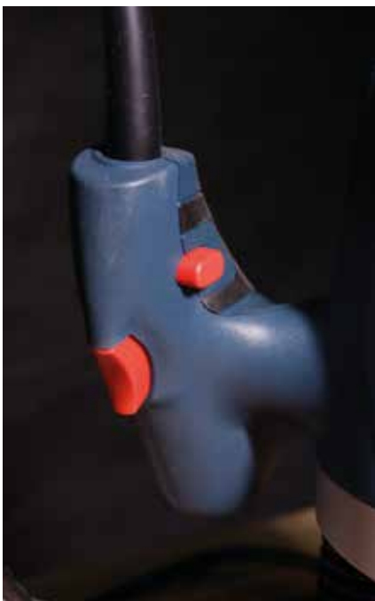
Kényelmes fogást biztosít a markolat.

A mélységütköző funkcionalitása nem lett túltolva. A finomállításról a felhasználónak kell gondoskodnia. Aki régi gépeken szocializálódott, annak ez nem jelent problémát, aki nem, annak ez egyfajta tanulási út lesz.