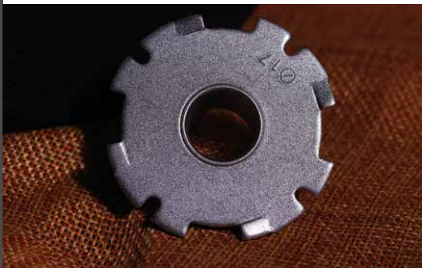
Két anyagból készített másológyűrű.

Az utóbbi években a felsőmarók piaci szegmensében is megfigyelhető a specializáció. Élmarók, akkus gépek, igazi nagy vasak érhetőek el. Lassan ott tartunk, hogy felsőmaróból is legalább négyet kell vásárolnunk a feladatoknak megfelelően. A GOF 130 Professional a nagyobb marók talpméretét és egy közepes maró teljesítményét adja, konstans elektronikával és kellően gyors állításokkal, megfelelő áron. A konstrukció nem megy bele rizikós megoldásokba. Persze a másológyűrű óriási meglepetés volt – és régóta kerestem is egy ilyen megoldással rendelkező gépet. Az ergonómia is megfelelő, kényelmes