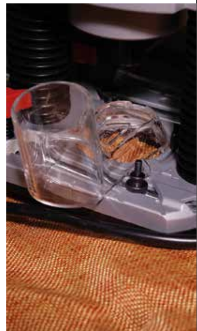
Elszívófej és a kis csavarja.