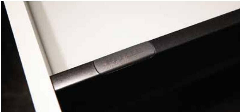
Így teljes a kép.

eszközök kiesését a játéktérről, de az előlap dőlését is korigálhatjuk vele. A próba során egy 300 mm-es frontot szereltem fel. Gyorsan! A gyorsaság azt jelenti, hogy az előlap-tartók vonalában, magasságban szinte bárhol mindössze egyetlen 10-es furatot kell elkészítenünk 12 mm mélyen. Ehhez egy forstnerfúró a legjobb választás. A hátfalhoz történő csatlakoztatás mindentől független, mivel annak hátuljához két csavart kell betekernünk.