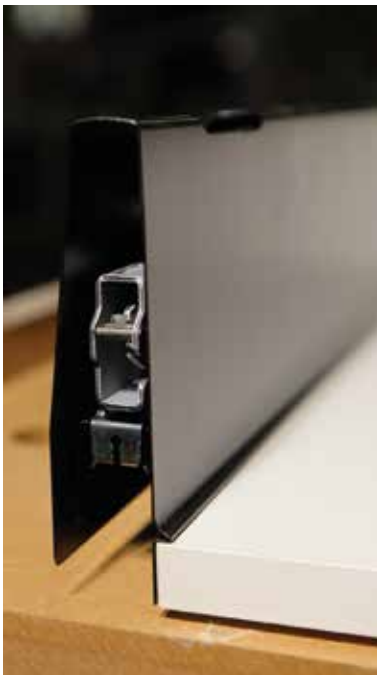
A fenékre történő rátaakarás egy a sok apróságból, ami teljessé teszi a kávéát.