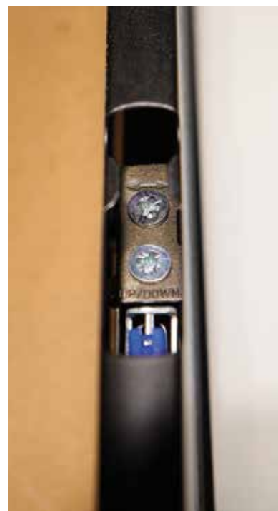
Az állítócsavarokkal tudjuk az előlapot beállítani.

A Matrix Box P minden tagjánál lehetőség van magasító korlát felszerelésére, ha nagyobb fiókmagasságot szeretnénk elérni. A korlát nem csupán megakadályozza a tárolt