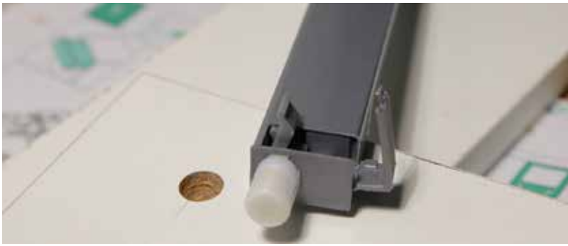
A korlát egy feszítő dübellel csatlakozik a fronthoz. A furatba illesztés előtt a kis takarósapkát ki kell pattintani és az alatta lévő kart oldani. Így könnyen beilleszthető a furatba.