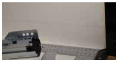
Hagyományos módszer a felrajzoláshoz.

A frontfelszereléséhez egy-egy előlap-tartót kell felfűrni. A csavarozásra itt is két lehetőség adódik. Forgácsolapcsavar vagy eurocsavar. Mindkét meg-