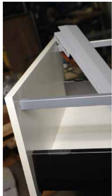
Diszharmónia a magasító korláttal. Hátterben az alacsonyabb káva.

A bemutatóra a vasalatokat a JAF Holz Ungarn Kft. biztosította a rendelkezésünkre. Köszönjük a segítőkész együttműködést!