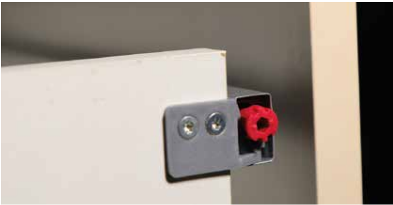
A magasító korlát hátsó fele és az állítócsavar.