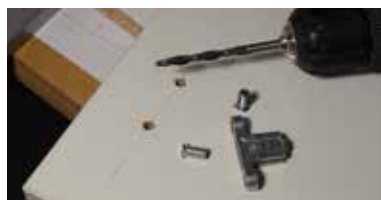
Az eurocsavaros rögzítéshez 5x12-es furat szükséges.