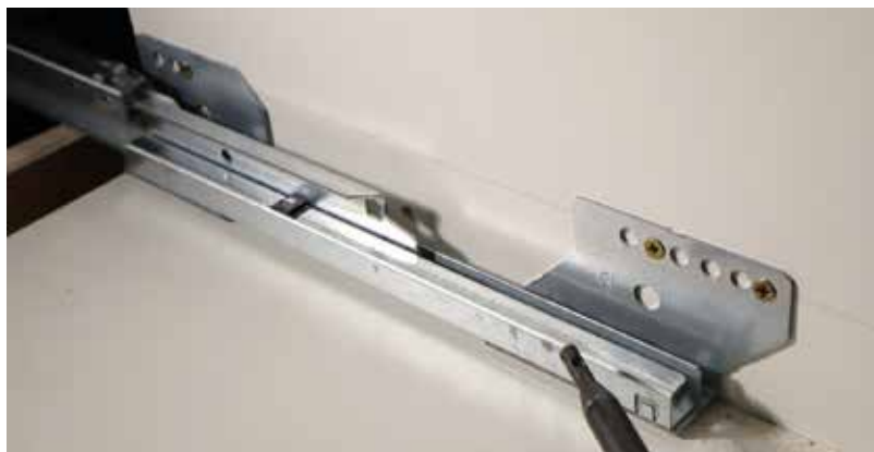
A 4x16-os forgácsolapcsavart eurocsavarral is kiválthatjuk. Jól látszik a fióksín füles konstrukciója.

oldást kipróbáltam, működnek. A két furat pozíciójának meghatározásához a fentebb lévő ábra nyújt segítséget, teljesen egyértelműen számíthatók az értékek. A szerelés megkoronázása a front bepattintása a kávéba.