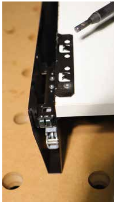
A csavarkötés mellett lehetőség van csavarmentes szerelésre is.