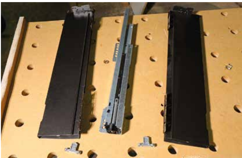
A fiók fő elemei.

megy. Talán a lapgyártók is felismerik idővel, hogy több „UNI” szint kellene gyártaniuk az egyre növekvő fiókkáva eladások mellé. De ez egy másik cikk témája lehet. (A JAF Holznál ezt már felismerték, ezért ott már a fehér, a világos szürke 16 mm-es lapon kívül kapható antracit színű 16 mm-es lap is). Az egy fantasztikus dolog, hogy a hátlap és a fenék szélessége megegyezik. Ez szabászat és anyagkigyűjtés szempontjából is nagy könnyebbséget jelent. A fenék hossza a névleges méretnél 3 mm-rel kisebb kell, hogy legyen. A hátfal magasságát a gyártó a leírásban közli, ez a 115-ös kávémagasság esetében 92 mm. Viszont, ha magasított oldalkorlással szeretnénk kivitelezni a fiókot, akkor annak utána kell számolni.