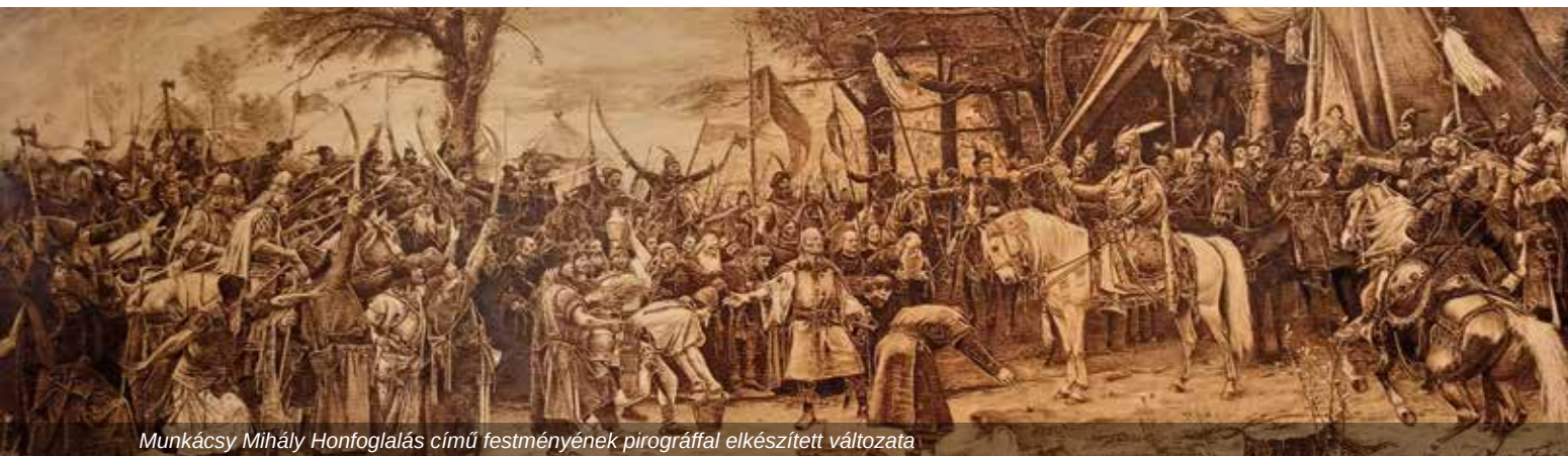
Munkácsy Mihály Honfoglalás című festményének pirográffal elkészített változata

..... www.facebook.com/totyopyrography , www.instagram.com/totyopyrography