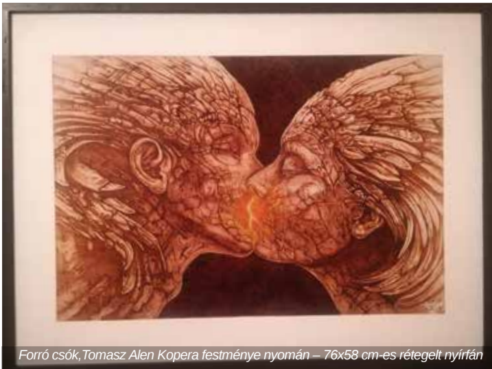
Forró csók, Tomasz Alen Kopera festménye nyomán – 76x58 cm-es rétegelt nyírfán