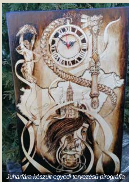
Juharfára készült egyedi tervezésű pirográfia

– 2013 decemberében történt. Abban az évben kézzel készített ajándékot terveztem adni a szeretteimnek. Csak épp azt nem tudtam, hogy mi legyen az. Biztos voltam benne, hogy fából fogom elkészíteni, viszont a technikát illetően nem jutottam döntésre. Ekkor találkoztam a pirográfiával, a tűzírással. Megfelelő eszköz híján, tűzben hevített csavarhúzóval rajzoltam meg a fába életem első égetett mintáját. Innentől kezdve igazából nem volt megállás. Megvettem az első pirográf gépemet – és ez a fához kapcsolódó szerelem azóta is tart,