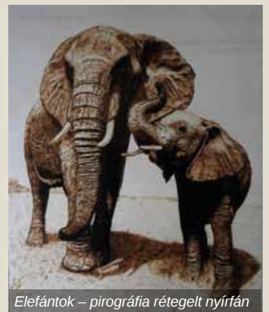
Elefántok – pirográfia rétegelt nyírfán