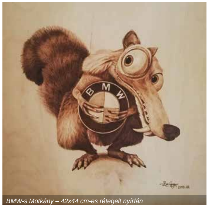
BMW-s Motkány – 42x44 cm-es rétegelt nyírfán