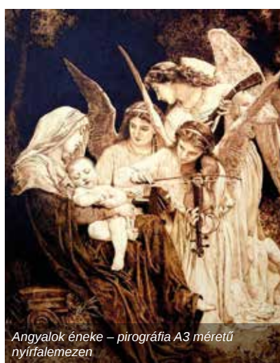
Angyalok éneke – pirográfia A3 méretű nyírfalemezen