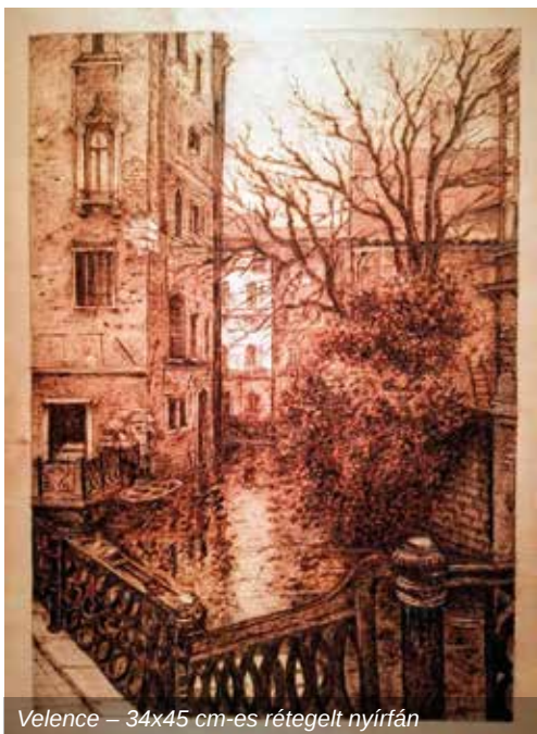
Venecia – 34x45 cm-es rétegelt nyírfán

teljesen elbűvöltek. Összehasonlítva az általam korábban használt felületekkel, a fán pirográf eszközzel égetni lassabb, türelmet igénylőbb folyamat. Grafikai ábrázolásmódja hasonló, mint szénrel vagy grafitral rajzolni, azonban szükség esetén nehéz ezen az alapanyagon javítani. A világos tónusok korrigálhatóbbak, mert csak felszíni nyomok, viszont szinte lehetetlen rajta javítani a sötétebb tónusokat, mivel azok mélyebben beleégnek a fa szerkezetébe. Ennél a technikánál nagyon