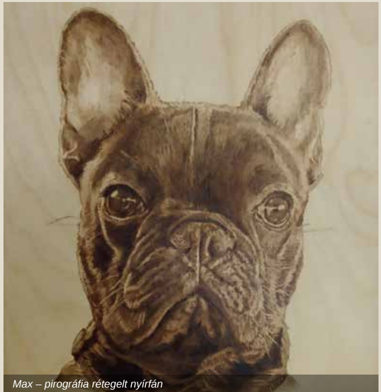
Max – pirográfia rétegelt nyírfán