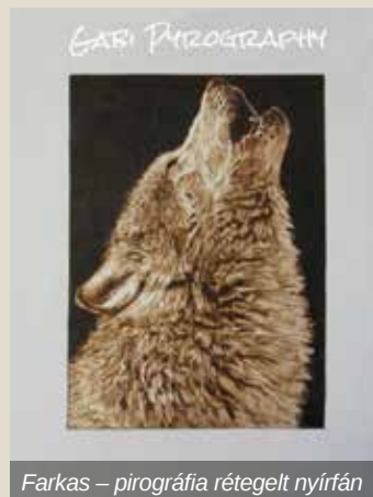
Farkas – pirográfia rétegelt nyírfán