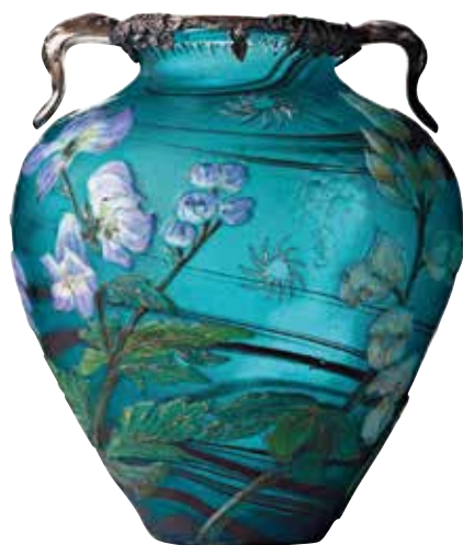
Émile Gallé: Üvegváza

vészetben kifejlődő mozgalom. A tárgyalkotásban, a grafikában és a festészetben, de gyakorlatilag minden művészeti ágban megtalálta a maga útját. Az építészetben is gyakran folyamodott az ipar- és a képzőművészet segítségéhez. Jellemző rá, hogy kerülte a szögben törő, egyenes vonalakat. A geometriai formák helyett a természetes növekedés élményét keltő, szabadon áramló formákat kedvelte. Arra törekedett, hogy az alakulóban lévő élet lendületét, a technikai fejlődés hatására mind jobban felgyorsuló jelent közvetítse. Ugyanakkor volt benne valami romantikus indíttatású szembefordulás is a modern világgal. Tiltakozott a gyáripar, a tömegtermelés emberrnyomórító személytelensége ellen. A termelés folyamatában egyszerű eszközzé vált, mechanikus részmunkát végző emberek helyett az alkotói szabadságot akarta visszaadni. Nem beszélve a sorozatgyártás silány minőségéről, az egyedileg, kézzel készült termékek magas minőségéhez képest.