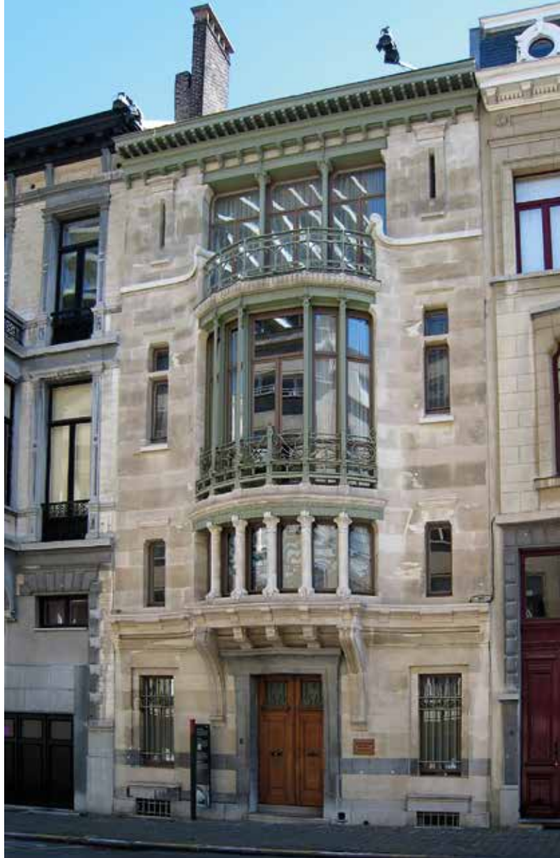
A Tassel-ház homlokzati képe