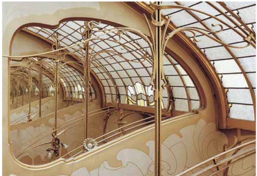
A Tassel-ház ikonikus lépcsőháza

rendszerrel, ezt mára nagyrészt használaton kívül helyezték. Az épület egyszerre praktikus és reprezentatív funkciót is ellát, miközben Victor Horta a tulajdonos saját ízlését és személyiségét is figyelembe vette a tervezés során. A kor társadalmi változásainak bemutatása szempontjából az épület különösen kimagasló példája lett a XX. századba való átmenetnek. 1956-ban kis lakásokra osztották, ami tönkretette az eredeti koncepciót a tágas, nyitott terekkel kapcsolatban. Az 1976. november