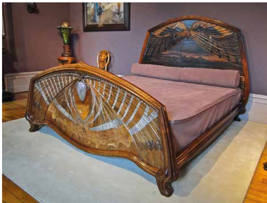
„Dawn and Dusk” ágy Émile Gallétól, Franciaország (1904)

Az egyéniség teljes értékű kifejtésére lehetőséget nyújtó kézműves munka örömét hirdette, hitt abban, hogy az alkotótevékenységben nyert öröm, kiteljesedés a társadalom bajait is orvosolni tudja. A képzőművészetek és iparművészetek között nem tett különbséget.