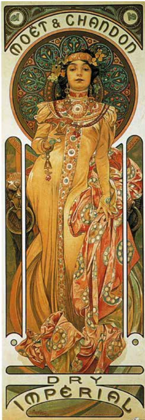
Alfons Mucha: Dry Impérial plakát

A művészeti irányzatok megismerése, felismerése fontos képesség (kellene, hogy legyen) az asztalozsákmában is. Egy stílusidegen bútor, vagy épületasztalos-ipari termék rendkívüli módon ronthatja az összképet. Az ember persze ki is fogyhat az ötletekből, inspirációra lehet szüksége. Ilyenkor érdemes egy művészettörténeti könyvet elővenni, s jobban belemélyedve utánajárni a stílusjegyeknek, a technikáknak. Például a szecesszió, amely nekem is az egyik legkedvesebb stílusirányzatom.