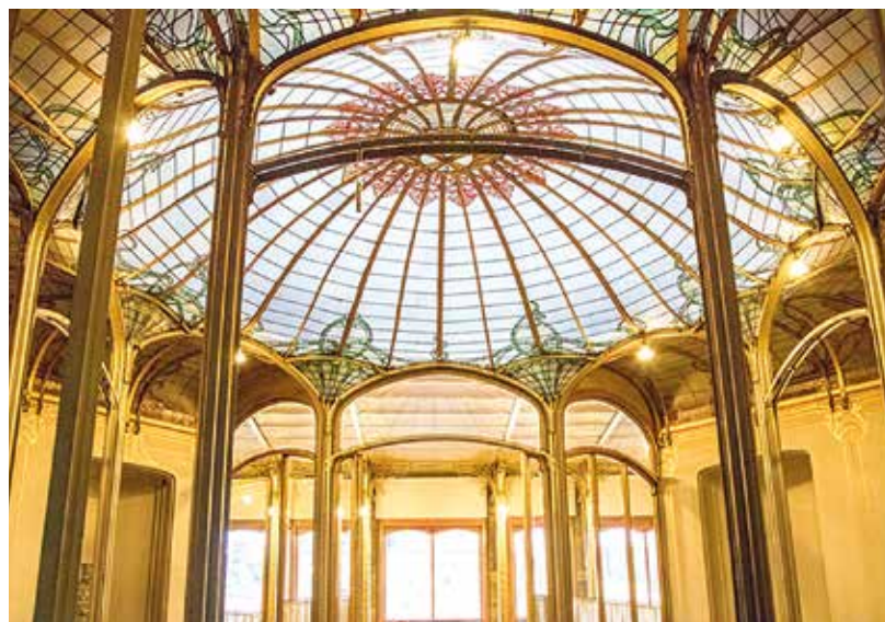
A fényekkel való játék fontos volt Victor Horta számára

Az épület egy 7,79 m széles és 29 m hosszú telken kapott helyet. Horta itt kísérletezett először az általa tervezett szellőző- és fűtési