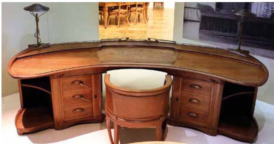
Van de Velde által tervezett íróasztal (Orsay Múzeum, Párizs) (1898–1899)