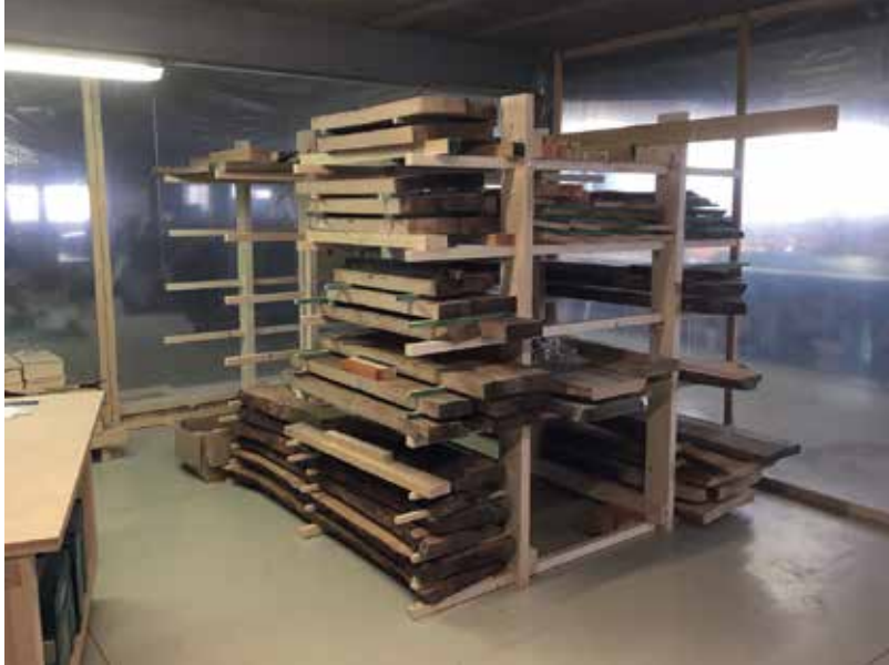
Sanyi pár éve figyeli a hirdetéseket és gyűjti a faanyagokat.