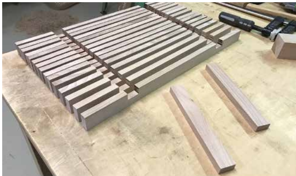
Illesztés után, kerekítés előtt.