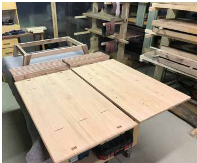
Csiszolást követően már kezd alakot ölteni a bútor.