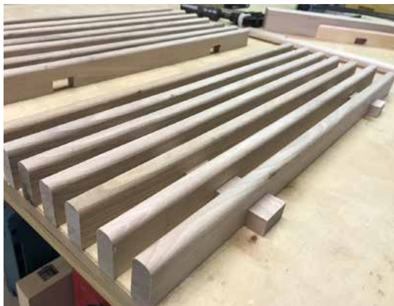
A rengeteg él kerekítéséhez egy asztalba épített marót használt.