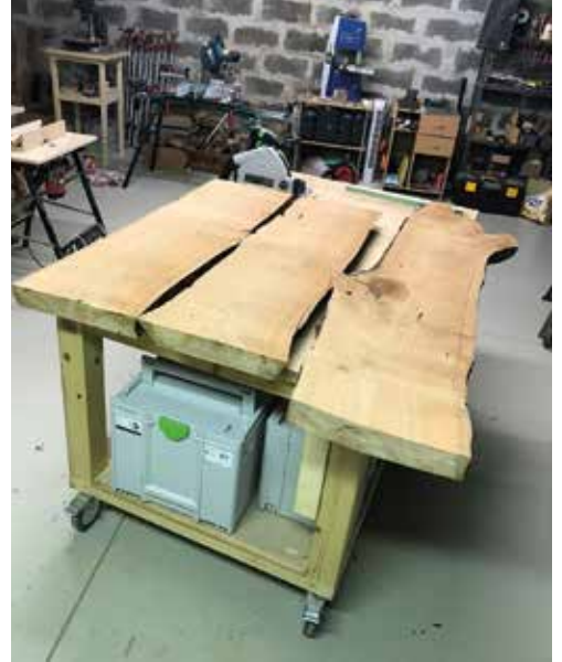
Kezdődik a szabászat.