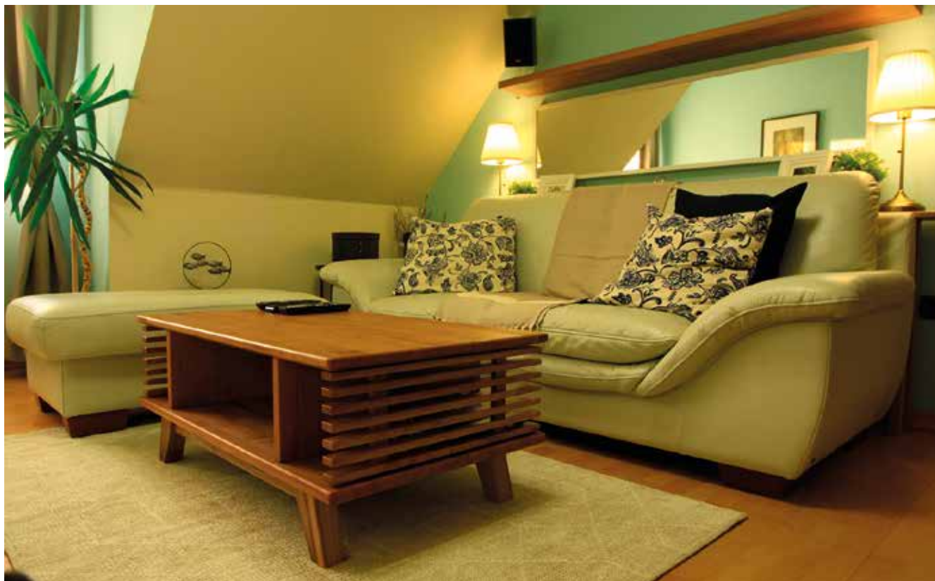
A kész asztal harmonikusan illeszkedik a nappaliba és teszi azt teljessé.