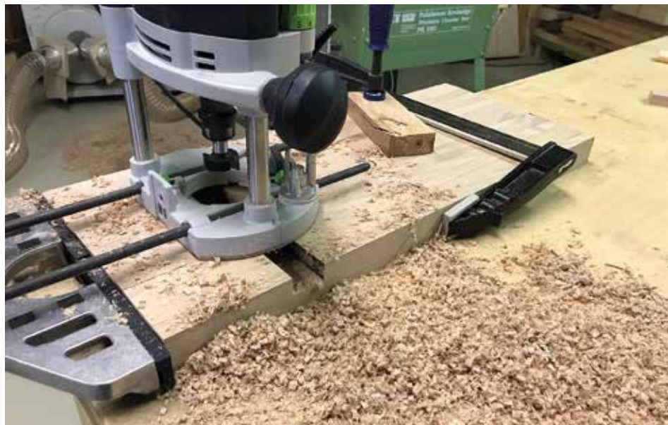
Dolgozik az OF 1400