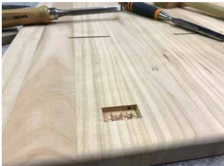
Nagyolás felsőmaróval, majd finomítás kézzel.