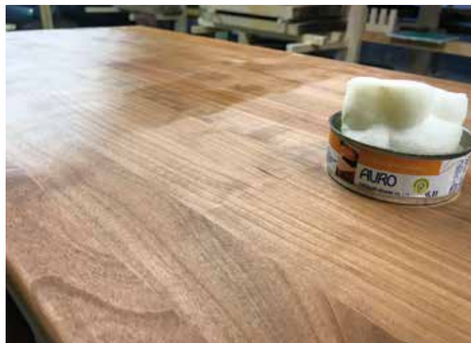
A viaszolás már komolyabb feladat.