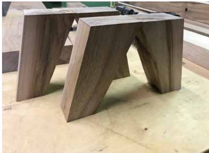
A kónuszos lábak kialakítása sem tartozik az egyszerű műveletek közé.

A csiszolást excentercsiszolóval végeztem P120-as szemcse-nagysággal, majd nedvesítést követően P180-as csiszolóanyaggal finomítottam. A lapok alsó felét olajjal kezeltem és összeragasztás, száradás után a többi alkatrészt is keményolajoztam. Egy nap elteltével az asztal lapját még méhviasszal kezeltem és políroztam.