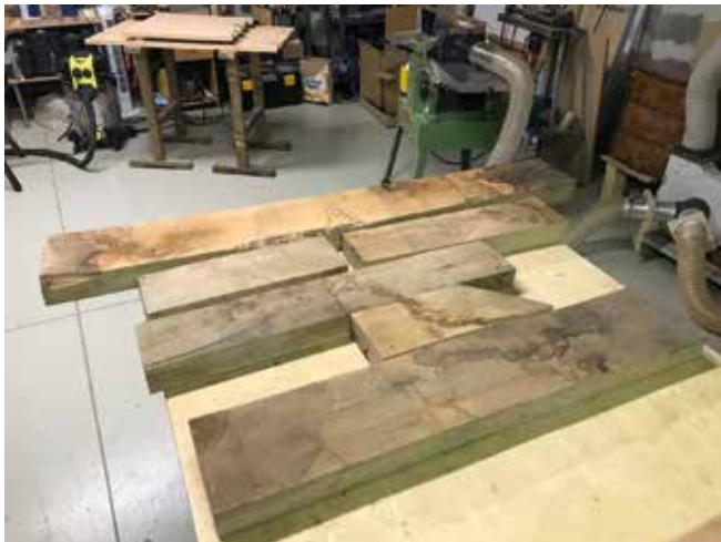
Gyalulást követően kezd kirajzolódni a fa mintázata. Sanyi ezt is számításba vette a készítésnél.