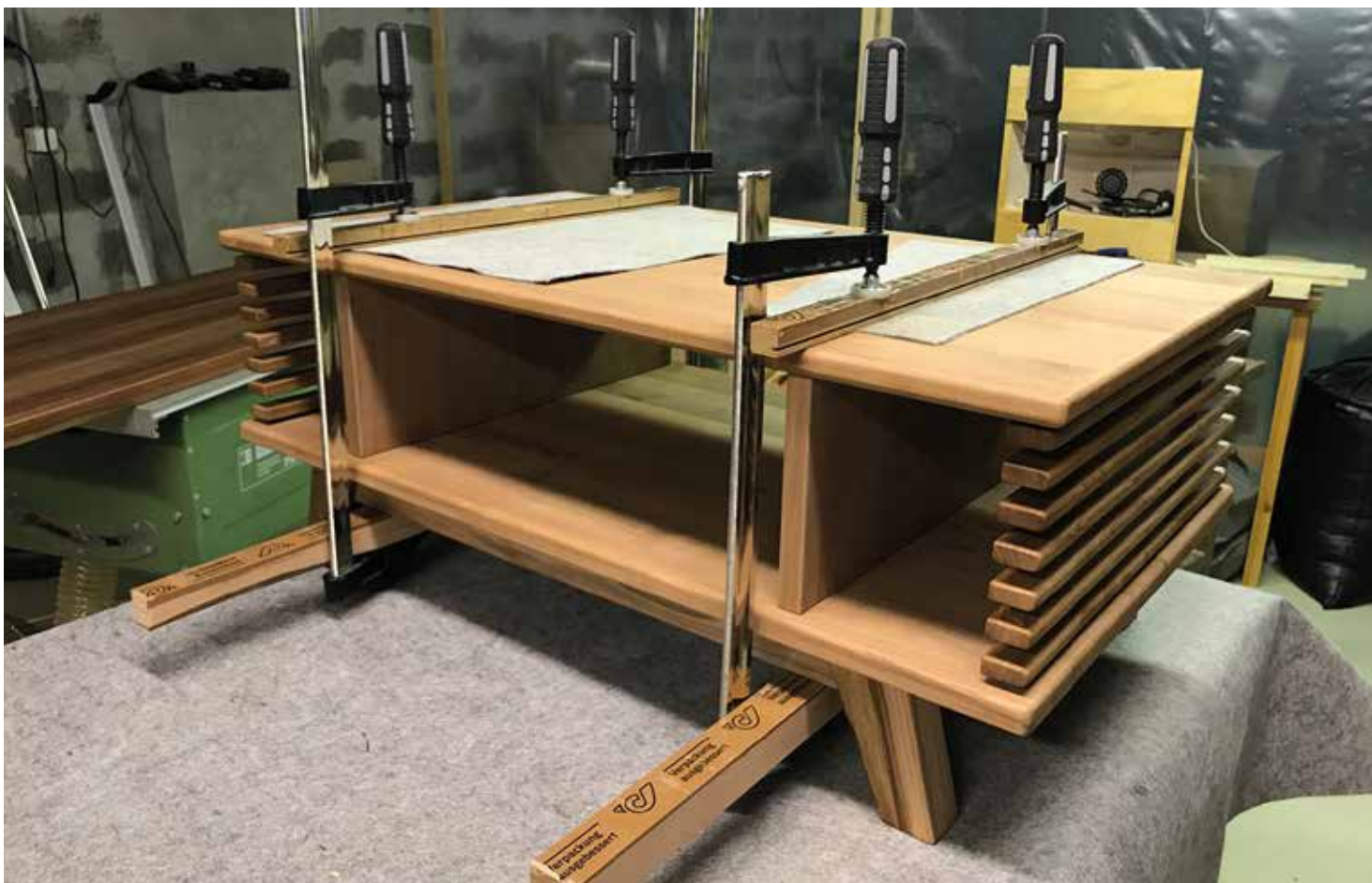
A főbb elemek összeállítása

”Egyelőre csak gyakorol, tapasztal, alkot – és ismerkedik a szakmai fortélyokkal. Mindezen tulajdonságok és törekvések példát mutathatnak a kezdőknek, hogy a tömegcikk gyártásán túl is van élet.