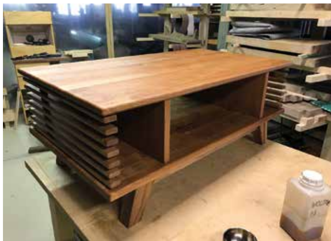
A keményolaj felvitelét követően.

”Egyelőre csak gyakorol, tapasztal, alkot – és ismerkedik a szakmai fortélyokkal. Mindezen tulajdonságok és törekvések példát mutathatnak a kezdőknek, hogy a tömegcikk gyártásán túl is van élet.