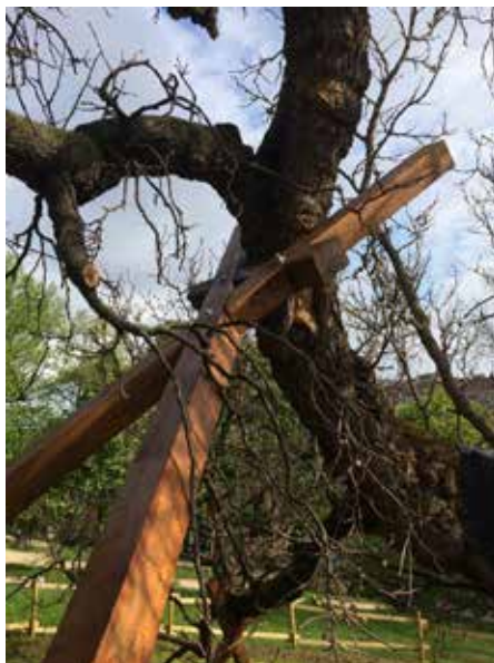
Jelenleg támasztékokkal sikerült stabilizálni szerkezetét.

támasztékokkal, figyelmeztető és tájékoztató táblákkal, környezetének rendezésével próbálják megóvni. Alacsony ágai fáramászásra csábítanak: nagyobb fesztiválok idején előfordul, hogy a tabániak kicsi, de elhivatott csapata ilyenkor védő sorfalat áll körülötte. Továbbá hivatalosan az I. kerület védelmét élvezzi, szerepelt például az Ökotárs Alapítvány Év Fája versenyében is, ezért cserébe még mindig kihajt, virágozik, sőt: terem is. ■