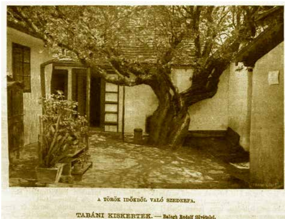
A TÖRÖK IDŐKBŐL VALÓ SZEDKERFA.

Mi maradt fenn hírmondónak az egykori Tabánból? Egy országosan is ritkaságnak számító fekete eperfa. Az, hogy mikor ültették a hegyoldalba, nem meghatározható pontosan. Egyes források szerint akár 300 éves is lehet. 1909-ben a Vasárnapi Újság azt írta: „Egy-két ilyen törökös vonatkozásra mutató házon kívül a törökvilág emlékeinek más hírmondói a fákon kívül itt már alig vannak. Ezek között is csak kettő olyan, melyről egészen biztosan meg lehet mértelei után állapítani, hogy gyökereit három-négy század előtt, talán valamely jámbor török rokonunk bocsátotta a föld alá. Eperfa mind a