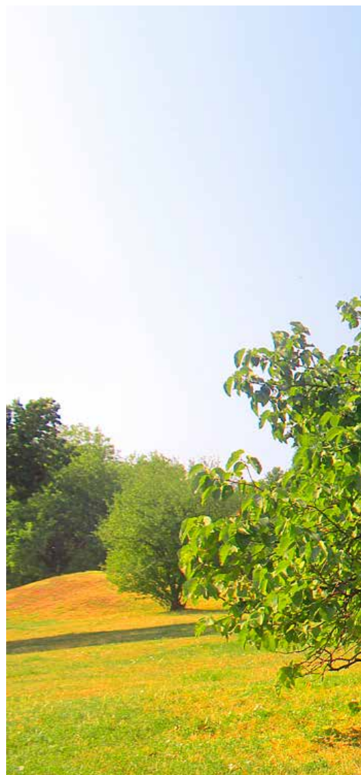
Egy, az ezredforduló után készült felvétel.

A Tabán valamikor Buda hangulatos és bohém városrésze volt. Ugyanakkor a régi, apró házak a szegénység és az ebből következő nyomor, a bűnözés hátterül is szolgáltak... De mindez a múlté: a Tabán egykori helyén, a budai várral szemközti Naphegy és a Gellért-hegy oldalában, már a '30-as évek óta egy közpark zöldell.