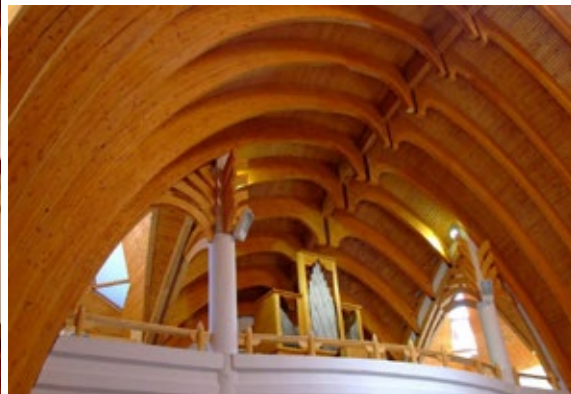
Törökvágási református templom, Kolozsvár