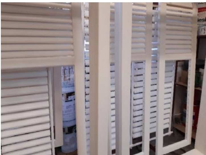
Termékeik a gyártás közben és beépítve.

dolgozott. Ennek hasznából és szülői támogatással sikerült faipari gépeket vásárolnia egyiket a másik után. A cég egyszemélyesként indult 1993-ban egy garázsban, aztán az egyik gépet olyan helyről vásárolta, ahol faajtót, faablakot is árultak, és éppen gondjuk volt egy termék beszerzésével. Rögtön adódott a lehetőség, és az adott gépet már általa gyártott áruval fizette ki. Kezdetben nyugdíjas szülei is segítettek a munkában, amíg 1994-ben megnősült és átköltözött feleségéhez a műhellyel együtt egy 80 m 2 -es régi épületbe. Ezt néhány év alatt kinőtték, már tízen voltak. Elkezdtek egy új műhelyt építeni, ami már plusz 200 m 2 -t jelentett. Ezt a megtermelt profit – azóta is szem előtt tartott – tudatos visszaforgatása tette lehetővé. Közben beszállítói lettek több áruházláncnak (Obi,