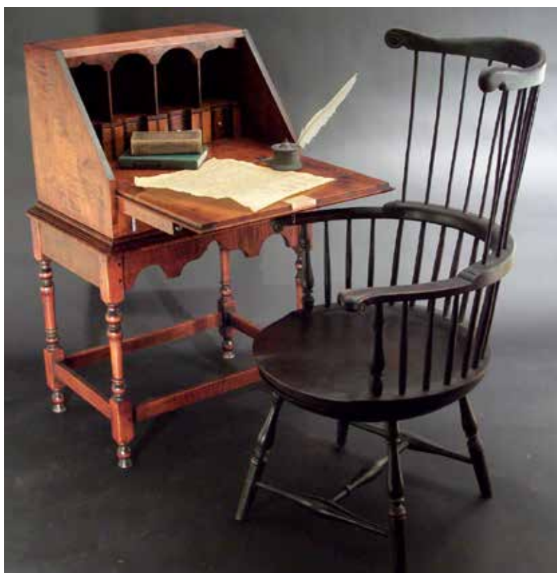
Az első forgószéket Thomas Jefferson találta fel, és állítólag ez az a szék, amelyben 1776-ban kidolgozta az Egyesült Államok Függetlenségi Nyilatkozatát. Windsor stílusú kivitelében számos esztergált elemet találunk. (Twitter/Presidential Studies Quarterly)

Természetesen a görögök, a rómaiak és az egyiptomiak is megismerkedtek az esztergálás tudományával. Míg a görögök az egyiptomi minta alapján készítették el a gépeiket csak famegmunkálásra, addig a rómaiak már kövekkel és bronztárgyakkal is képesek voltak dolgozni. A római esztergagépek oda-vissza húzással működtek egy feltekercselt zsinór segítségével. Ezt később felváltotta a modernebb lábhajtásos esztergapad. Ilyen mechanikus gépek még a közelmúlt népi esztergályos mestereinek műhelyeiben is megtalálhatóak voltak, de ma már inkább csak skanzenekben szemlélhetők meg üzem közben. Napjainkban a technika már teljesen kiforrott, profi esztergagépek segítik a munkafolyamatokat. Leginkább a fémesztergálás futott be óriási pályát a modern időkben. Az egyetemes eszterga kezelői mindig is nagy megbecsülésnek örvendtek, az '50-es, '60-as évek politikájában különösen: ugyanis ők jelentették a tökéletes munkásembert. Utódaik, a számítógép-vezérelt CNC-esztergákat értő gépkezelők és beállítók pedig