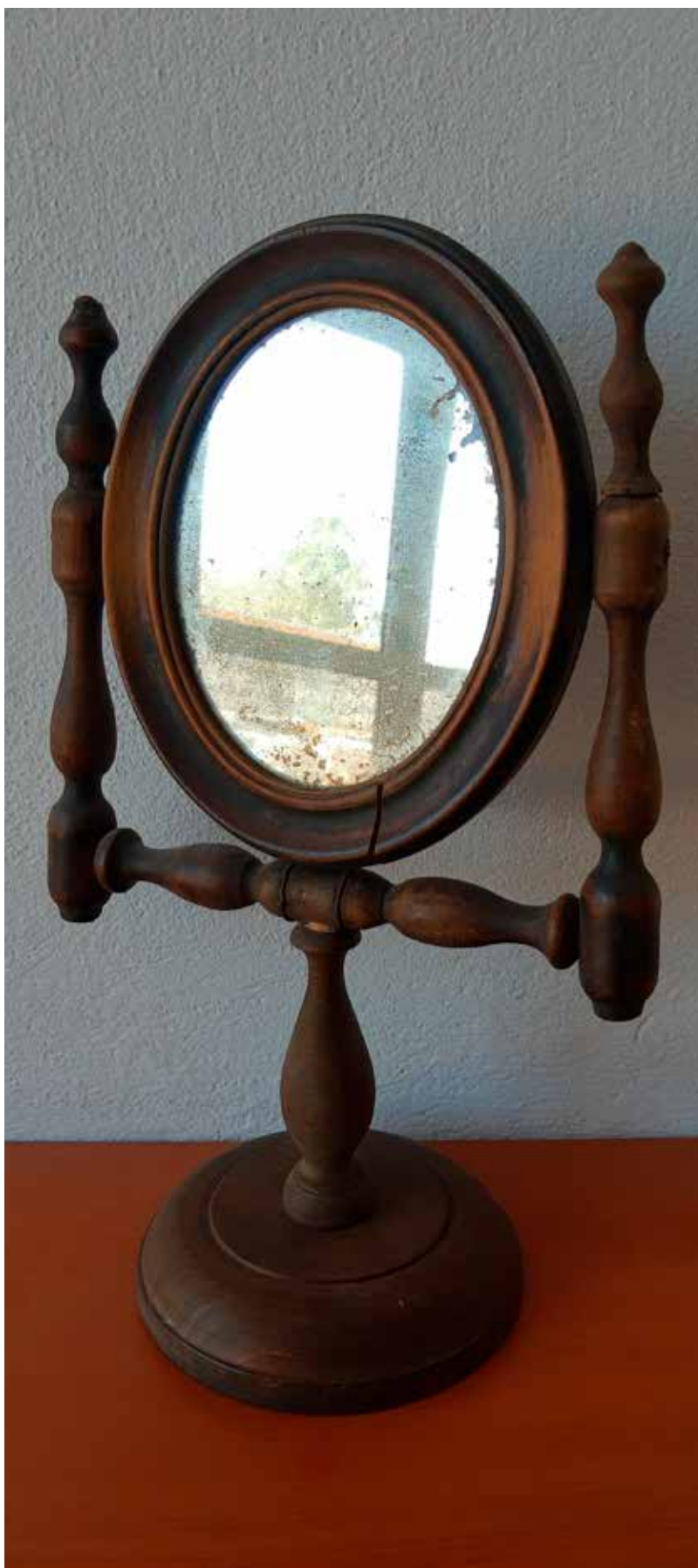
Sok háztartásban használtak ilyen ónémet stílusú piperetükröt, amelyet nemcsak az asszonyok tartottak nagy becsben, hanem az urak is, hiszen ezt használták beretvállalkozáskor. Ha a szülők nem figyeltek, kiváló gyerekjáték válhatott az esztergált faelemekből összeállított kellékből.

Saját vállalkozásunkban a fa gyöngyfűggöny nagy szerepet játszott, hiszen egy időben slágertermékünk volt. Cégünk elődje az állami tulajdonú Esztergomi Fatömeccikkipari Vállalat volt, ahol hűen a névhez, nagy hagyománya volt a nagyüzemi gyártásnak. Gyúrotábla, a nyújtófa, a derelyeszaggató, a tv-láb és más hasonlóak készültek a hétköznapi igények kielégítésére. A fa gyöngyfűggöny ezek közül a termékek közül kiemelkedett, ugyanis a '90-es évek hajnalán a kor vadkapitalista közegében egy frissen indult vállalkozás számára a biztos lábra állást jelentette. A különböző kivitelű gyöngyfűggönyöket számtalan kereskedőhöz szállítottuk be, ezek között igazi mikrovállalkozások, például falusi kisboltok, maszek kisvárosi barkácsüzletek is szerepeltek. A hirtelen jött szabadságban tucatszám nyíltak az ilyen apró boltok, melyek a nagy multinacionális barkácsruházak megje-