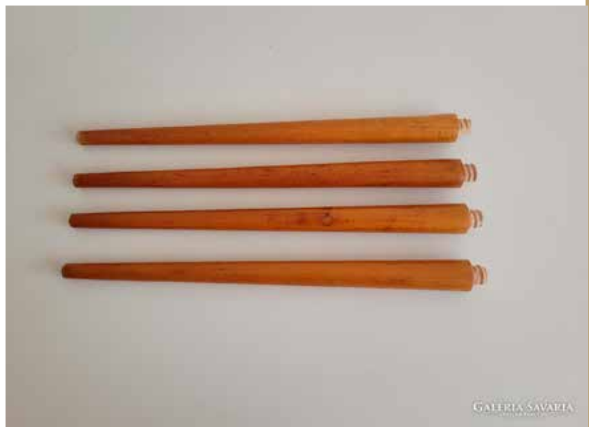
Egy retró tv-láb-szett, mely tartható asztalhoz, komódhoz, lemezjátszós rádióhoz, vagy akár nevéhez hűen egy régi fadóbozós televíziókészülethez is. Most használtan a barkácsolók kegyeit keresi egy hirdetési oldalon.

4–5 darab is be volt üzemelve. Jól megfért egymás mellett a '20-as évekből származó Kirchner-matuzsálem és a '80-as években gyártott, biztonsági fékkel felszerelt (akkor), rendkívül korszerűnek számító Kiskőrösi fűrészgép is. A gyártáshoz tehát sosem használtak műszáritott faanyagot, ennek az az oka, hogy a késztermék igen kis méretű, így látványos vetemedésre esetében nem lehetett számítani, még az amúgy a nagymértékű méretváltozásra képes bükk esetében sem. Ha esetleg néhány golyó rakoncátlan módon a száradás miatt mégis elrepedt, az mit sem számított a minőségben, hiszen a kisipari technológia miatt minden munkafázisban sok-sok selejt keletkezett, melyeket, ha másol nem, a történet végén: a fűzés során ki lehetett venni a folyamatból.