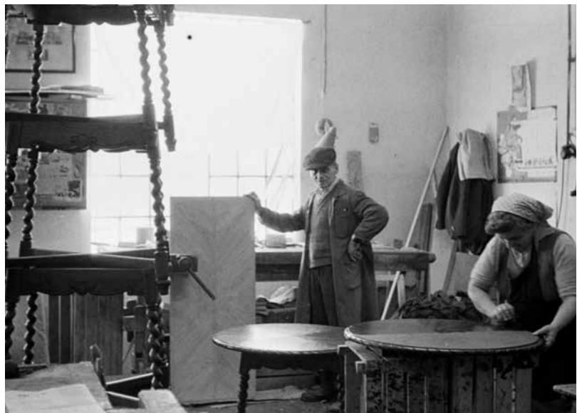
A stílbútor-garnitúra kerék asztala készül a Ceglédi Stylus Faipari Ktsz. részlegén, '70-es évek.