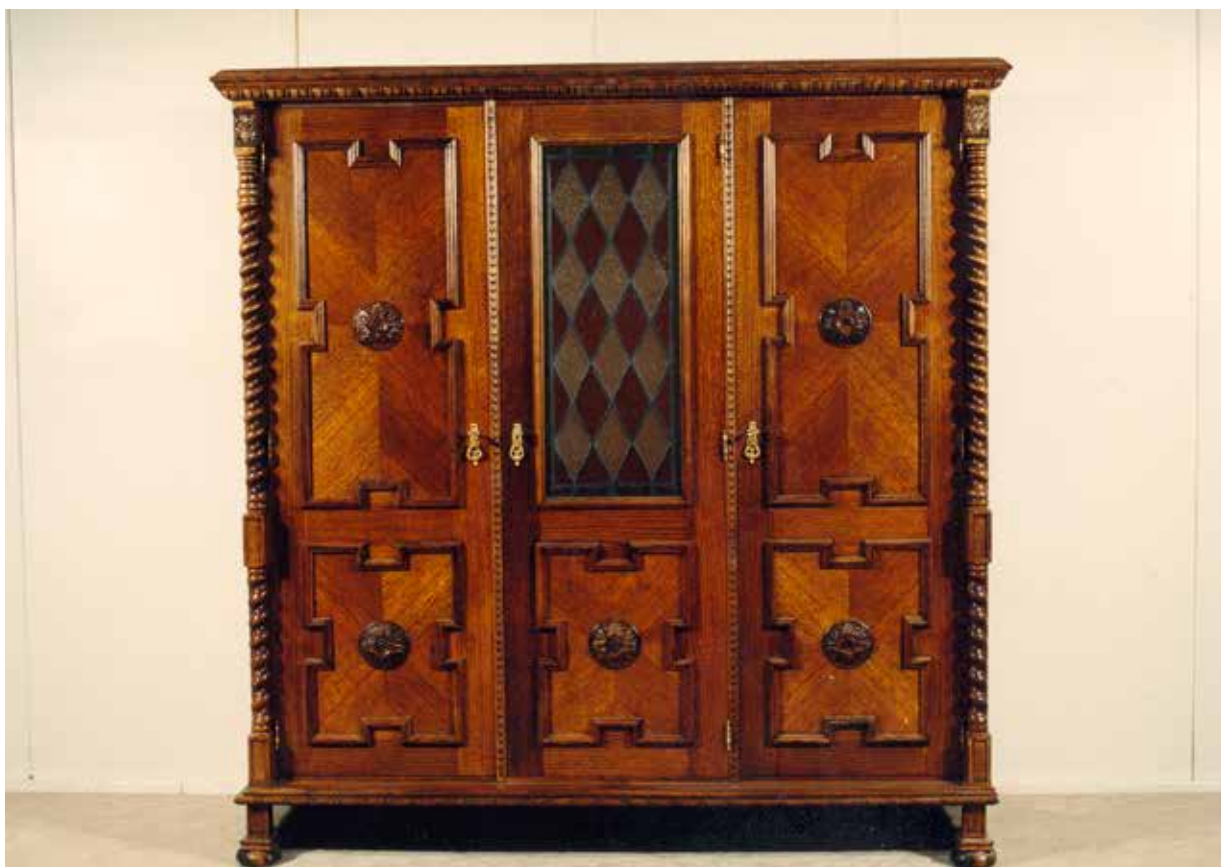
A közismert „koloniál”: csavart oszlopok, világos szerkezet, faragott díszek.

tett kísérleteinek során fejlesztette ki a ma is használatos módszert, a tömör fa acélszalagos sablonban történő formálását. A hőkezeléssel alakíthatóvá tett faanyag a sablonból a száradás után kivéve megtartja alakját és masszív alapanyagot biztosít az alkatrészek számára. A versenyelőnyét biztosítandó, szabadalmaztatta is a technológiát: „a gőzzel vagy forró folyadékba mártással hajlított faelemekből készült székek és asztallábak gyártására”. Michael Thonet a XIX. század legnagyobb bútorgyártója volt. Amikor 75 évesen meghalt, művét már az egész világon ismerték. Élete során a bútorigaripar kézműves jellege átalakult ipari tömeggyártássá. A fejlődésben fontos szerep jutott a gőzgép feltalálásának, mely teljesen átalakította a termelési folyamatokat, kiszélesítette a szériászerű termelést. A klasszikus tonettszékek íves keresztmetszetű alkatrészei ugyan nem feltétlen esztergálással, sokkal inkább gyalu-lással és körmarással készültek, de mégis fontos mérföldkövet jelentenek, hiszen mindenhol megjelentek ezek a formák a világon, így divatot teremtettek, ezzel sok más kisebb