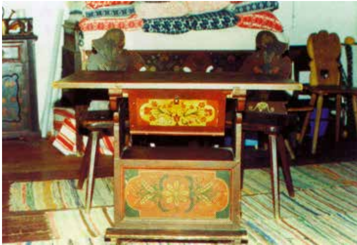
Kamarás asztal kenyeresfiókkal és titoktartóval.