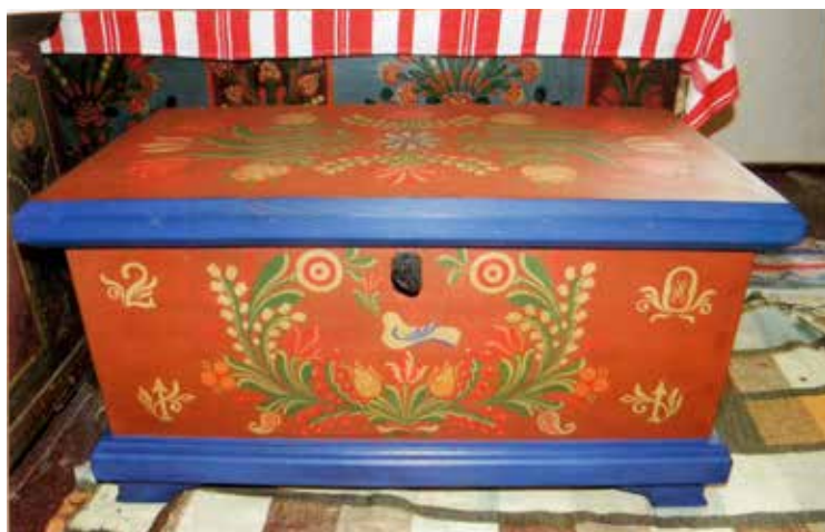
Festett ládák a két alapszínnel: jobbágykék és barna.