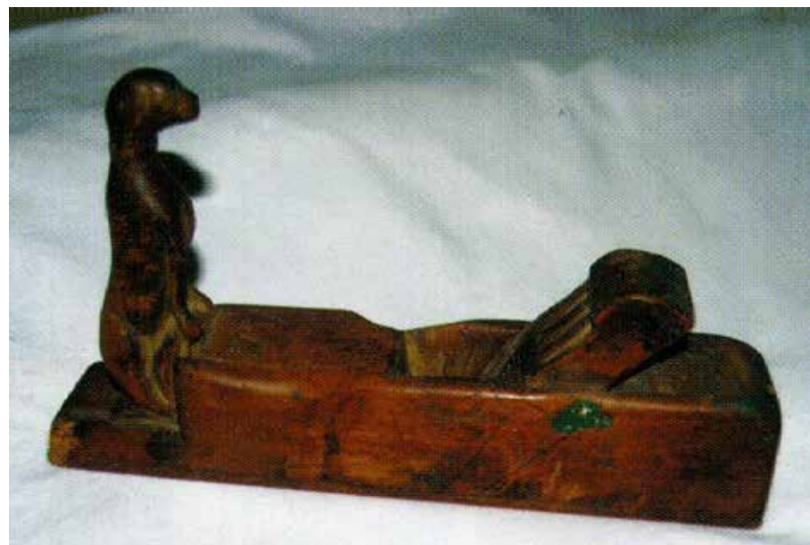
Őrlőkő a festék készítéséhez, kutyafejes gyalu és alapgyalu.