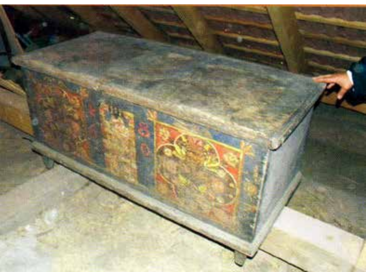
Régi festett láda restaurálása.

A Sütő család háza egyben néprajzi múzeum is. Bútoraik az 1800-as évekből valók. Mindegyiken szerepel a készítés évszáma.