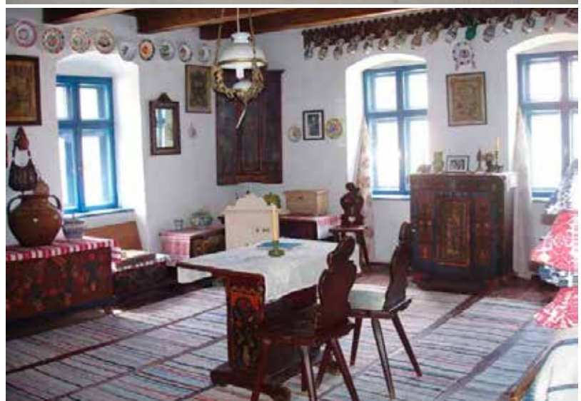
Az ősi családi ház és berendezése.