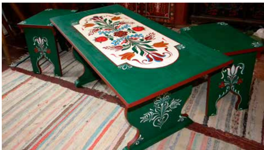
Festett asztal hokedlikkal.

zet, a vasalatok, a zárok is hagyományosak. Vargyason van egy fiatal kovácsunk, addig nézegette, tanulmányozta a 200 éves zár-szerkezetet, amíg elkészítette. De kanyarodjunk a festésre: a szegélyek színeit húzom meg, utána jön az alapozás. Ha betétek kerülnek rá, a körvonalakat megrajzolom. Ennyi család-ámítás van rajta. Utána megfestem a betét alapszínét, ugyanezt teszem a külső részekkel is. Meghúzom a szegővonalat, s akkor következik a kiinduló minta. Az igazság kedvéért elmondom, hogy egyből nem kezdtem el szabadkézzel festeni. Hatéves korom körül még csak ceruzával másoltam papírra a különböző kompozíciókat a régi bútorokról. Ezután következett, hogy nagypapa és édesapa felrajzolták a csokrot és megfestették a minta felét, aztán én a másik felét. Lassan kezdett a két fél hasonlítani, s attól a ponttól már közel volt számomra a szabadkézi festés. A kiinduló minta lehet kancsó, csokor, szív vagy margaréta. Ebből indul az úgynevezett erezés,