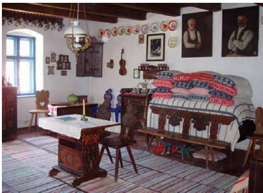
Az emlékszoba és egy rendelésre készített téka.