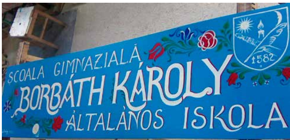
Akárcsak az elődök, ő is adományoz köztterekre, egyházaknak festett táblákat.