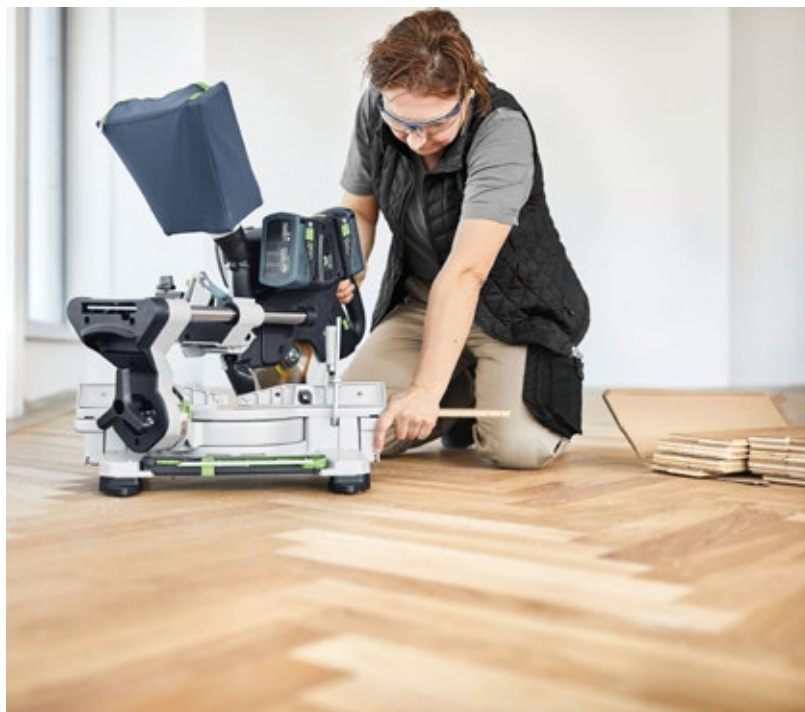
Hordozható használathoz és a kisebb fűrészelési munkákhoz a KSC 60 porzsákkal van felszerelve.