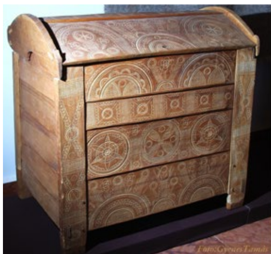
Régi palóc ácsolt láda