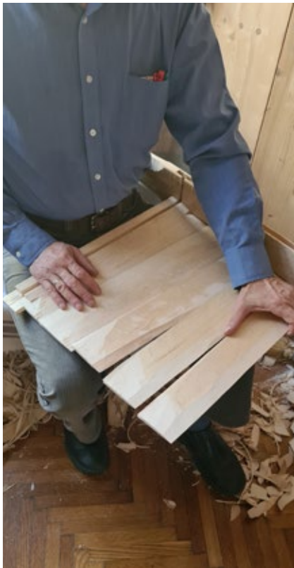
A deszkák egymásba illesztése