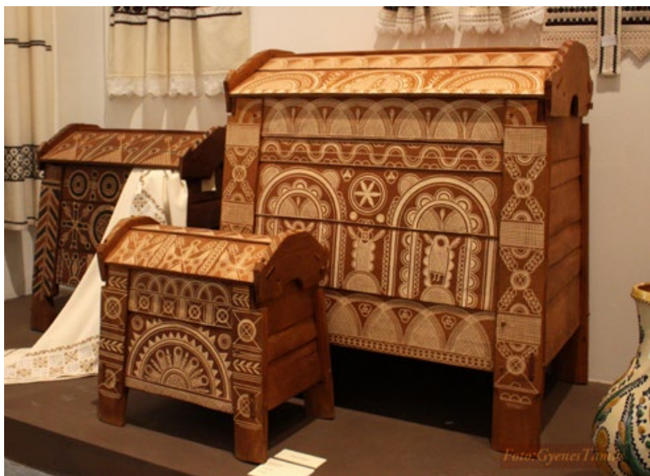
Különböző méretű és díszítésű ácsolt ládák az Élő Népművészet kiállításon

A palóc cifra szekrények mintázata azért olyan gyönyörű, mert „a hagyományos paraszti világban” a menyaszszonyok életük legnagyobb eseményére kapták. Ezek a mintázatok gyakran tudatosan megszerkesztett jelképirásos kompozíciók, virágokkal, emberalakokkal: jókívánságot jelen-