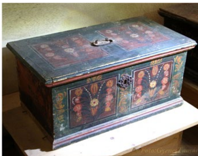
Fűrészelt és festett tulipános láda