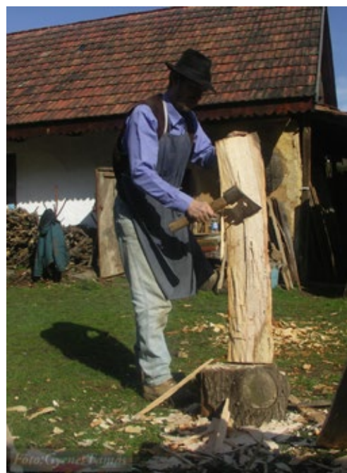
Hasított deszkák bárdolása