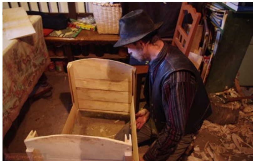
A szuszék összeállítása

Mindezen művelet után, ha jól egyben van végre az ácsolt láda, akkor el lehet kezdeni a füstölést, amivel egyrészt alapszínt, másrészt farontók elleni védelmet ad a ládának. A füstölés fél napig is eltart, s egy percre sem lehet otthagyni. A művelet hagyományos módon zajlik: nedves forgácsokkal fojtott tűzzel végzi, köz-