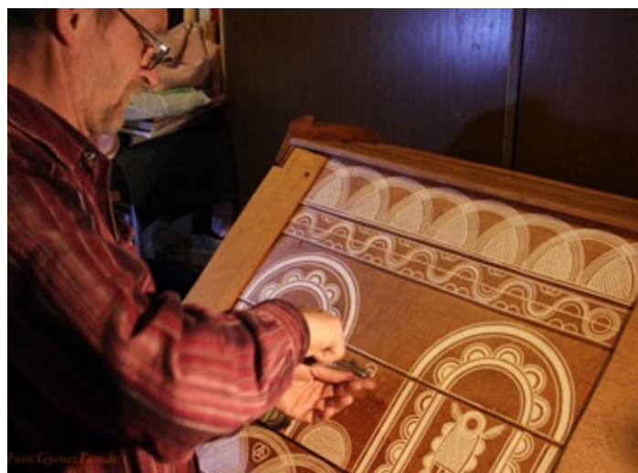
A szuszék díszítése karcollással ősi mintázzattal

ben folyton ügyelnie kell rá, nehogy lángra kapjon. Ezután egy természetes pácolással megerősített felületbe vési a mintákat. A minták cifrázását mindig a régi mesterek szokásai szerint végzi, csak köröket vagy köríveket rajzol és egyenes vonalakat. Mivel sokat tanulmányozta a 100–150 éves ácsolt ládákat, megismerte az azokon levő minták szerkesztési elveit és az előforduló képjeleket, így ezekből kiindulva a régi készítő műhelyek hagyományát folytatva tervezi meg az összkompozíciót. A képjeleknek viszont sok esetben jelentésük is van. A régi korokban a díszítés sosem volt öncélú. Az alkotás mindig kifejezett valami szándékot vagy az alkotót vagy a megrendelőt, de leginkább a kettőt együtt. A virágkorban készült palóc kelengyész ládáknál megfigyelhető a tudatos, szép, átgondolt kompozíció. A tudatosan átgondolt szerkesztésű jelképrendszerrel bíró legtipikusabb palóc ládákat a következő tulajdonságok alapján lehet jól felismerni: