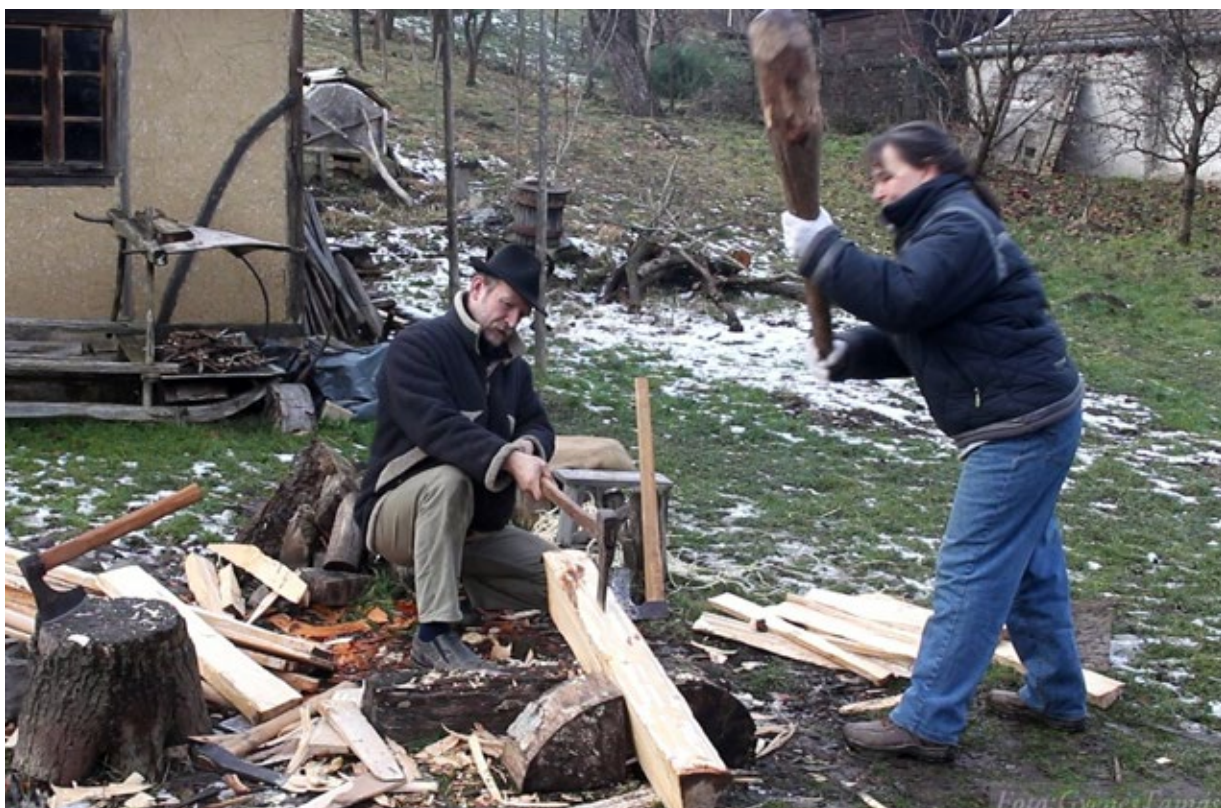
A negyedfa tovább hasítása felesége segítségével

Szuszékkészítésnél a munka az erdőn kezdődik, ahol ki kell választani a megfelelő, jól hasadó bükkfaanyagot. Legáltalában századok óta a bükkfát használják nálunk, kisebb arányban azonban tölgyből készült ládák is előfordultak (főleg az Alföldön). A legelső művelet tehát a lefűrészelt rönkök hasítása, általában negyedekre. Már ez is erőt próbáló és szaktudást igénylő feladat, a súlyos fatörzsek kezelése miatt. Nem