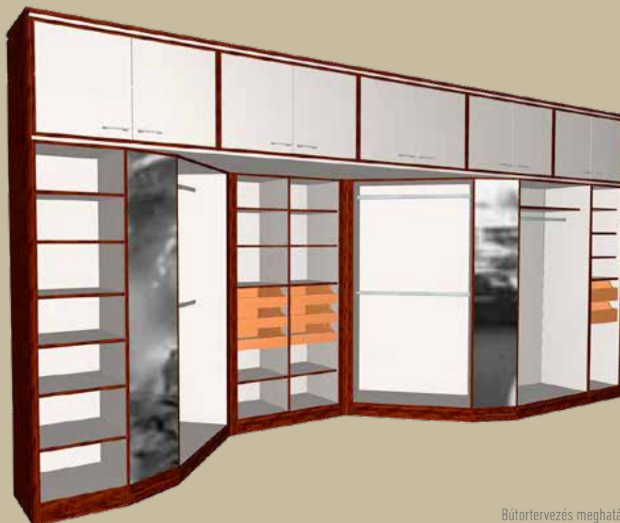
Bútortervezés meghatározott anyaggal