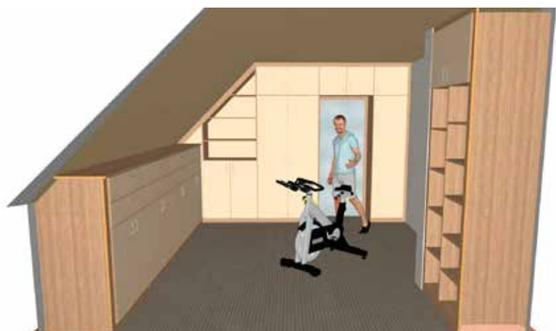
Teljes létesítmények építése a szobákhoz egyszerűen a SmartWOP segítségével

A SmartWOP szoftver csomagot a következő speciális funkciókkal kínálja Önnek a HOMAG és a Lignomat Kft: