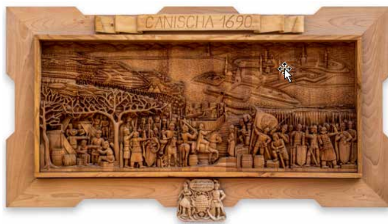
Kanizsa vár visszafoglalása táblakép

emléket állító táblaképe, mely egy trilógia része. Ennek további darabjai a Kanizsai vár eleste (és a Kanizsai vár visszafoglalása).