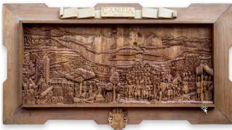
Kanizsa vár ostroma és átadása táblakép