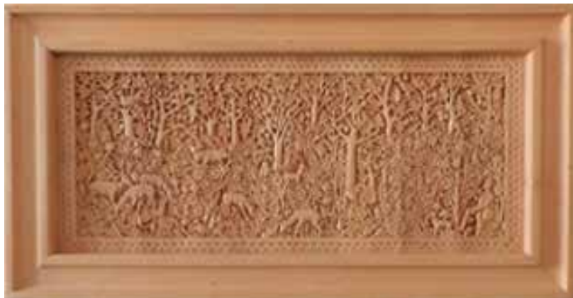
A zalai erdőkről álmodtam