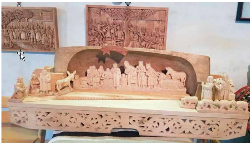
Falusi betlehem és mögötte: falusi életképek