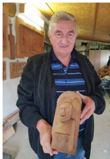
Az első gyerekkori szobra

A fa iránti vonzalmát családi örökségnek is tartja. Anyai nagyapja falusi ezermester volt. Gyulától 40 km-re, Okányban élt – idézi fel gyermekkorát. Apai ágon valamennyien iparosok voltak, tőlük hozta a műszaki szemléletet. Érdekelte a művészet, az iskolában rajzsakköre