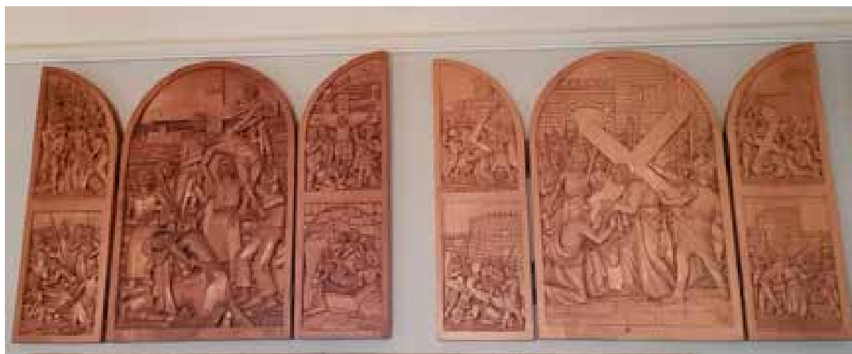
X – XIV Stáció

régi kapukon, kopjafákon is. Véső fafaragási technika lehet úgynevezett domború fafaragás vagy mélyített (hornyolt). A mélyített faragással történő díszítés vésőkkel készül, ezzel a technikával sokkal könnyebb és gyorsabb a kivitelezés. Ezzel a módszerrel már nagyobb felületeket is lehet díszíteni. A domború díszítmények úgy készülnek, hogy a felrajzolt motívu-