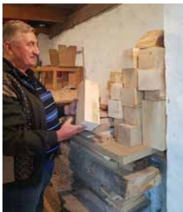
Az előkészített faanyagok