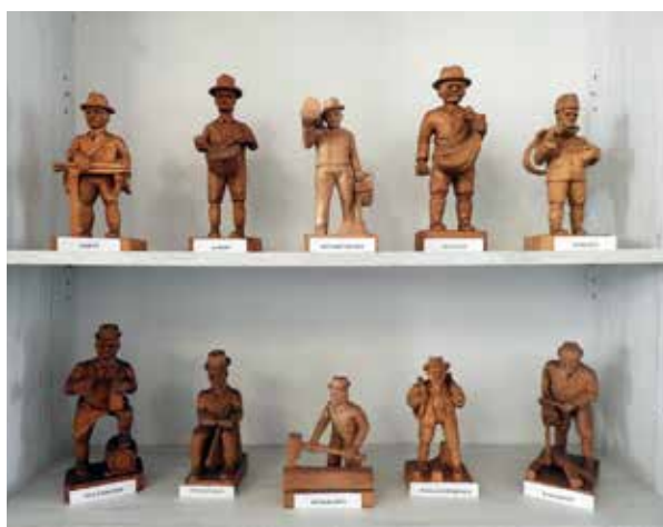
Mesterségek sorozat darabjai