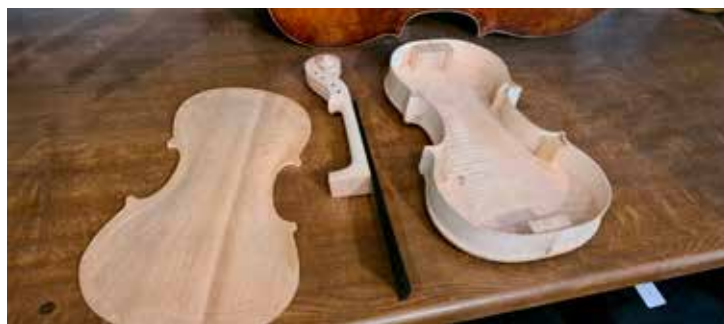
Hegedű részei: fedlap, nyak, és hátlap a kávéval

A befutó e-maileket és telefonokat is ő kezeli, ezzel is tehermentesítve a mestert. Ebben a légkörben legfeljebb a néha váratlanul beeső ügyfelek zavarják meg, bár többnyire előre egyeztetett időpontban jönnek.