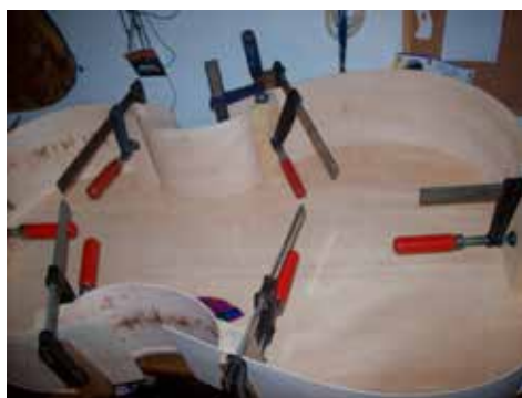
Formára hajlított káva rögzítése a tőkékhez