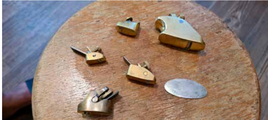
Különböző gyaluk és citlingező lapocská