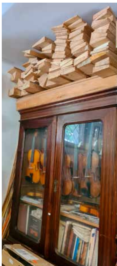
Képek a műhelyről és Képek a műhelyről és...