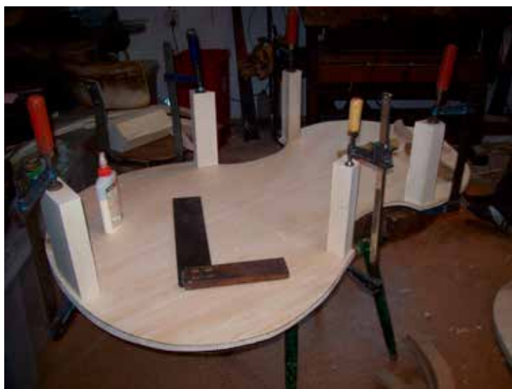
Nagybőgő hátlapjára a tőkék felragasztása