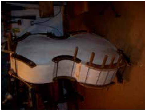
A hangszer összeépítése