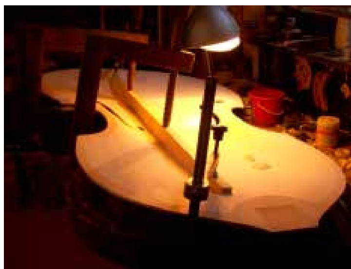
Gerenda ragasztása a tetőre