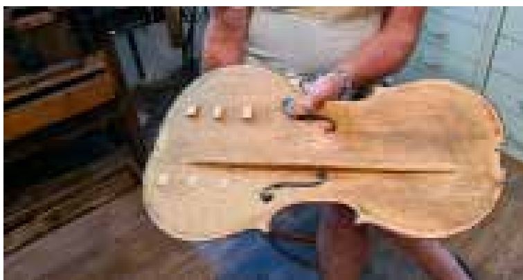
A fedlap belseje fele