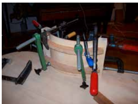
Káva egy részének hajlítása formára