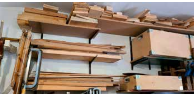
A műhely falán tárolt faanyagok