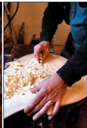
Nagybögő készítése képekben