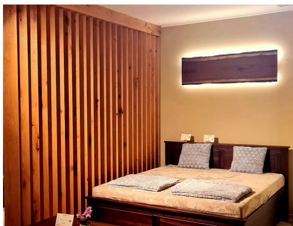
FEELING – Térrelválasztó rendszer