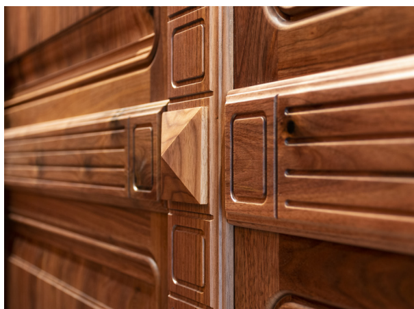
ROYAL – Kastély falburkolat