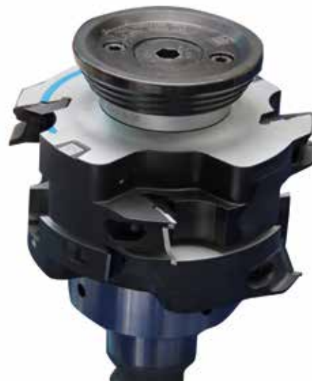
Leitz Hungária Szerszám Kft. 2030 Érd, Kis-Duna u. 6. Tel.: 23/521-900. www.leitz.hu

hogy hozzáférjünk valamennyi lapkát. A ProfilCut Q Premium-nál a kések könnyen hozzáférhetőek, egyszerűen cserélhetőek. Mivel a megnövelt élebenség magasabb igénybevételnek teszi ki lapkákat, ezért azok biztos rögzítése az egyik legfontosabb feladat. A ProfilCut Q-nál az élkörfutás pontossága érdekében a lapkák mind tengely-, mind sugárirányban nagyobb precizitású rögzítést kívánnak meg. A hornyos és stiftes megoldás kiválóan vizsgázott a gyakorlatban is. Lapkacserétől függetlenül a szerszám-élkörfutás mindig ugyanaz, mint új korában. A ProfilCut Q szerszámrendszer univerzálisan alkalmazható a faipar számos területén, így alkalmasak nyílászáró, bútor, vagy akár padló megmunkálására egyaránt.