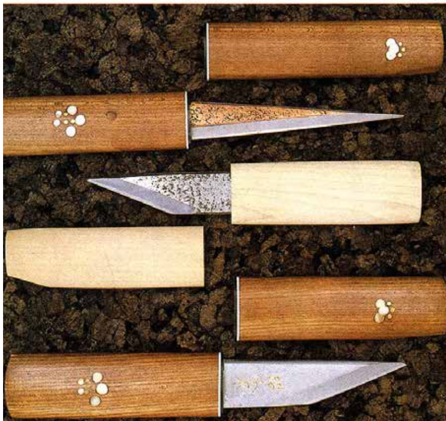
► Faragó- és intarziakészítő kések .