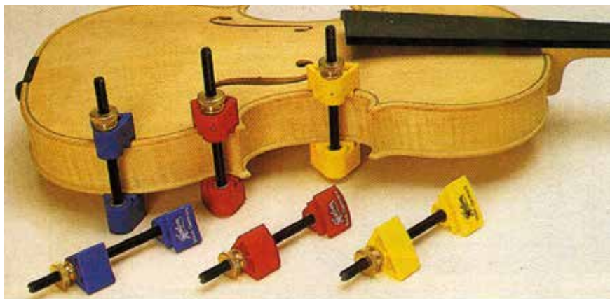
► Speciális szorítók és használatuk.

A különleges szerszámok, eszközök mellett speciális alap- és segédanyagok, valamint kiegészítők szükségesek a vonós hangszerek készítéséhez. Kínálatukban szerepelnek az alábbiak: lófarokszőr a vonóhoz Mongóliából, Kanadából, Japánból és Kínából. Ezenkívül megtalálunk mindent, ami a vonó készítéséhez, a feszítéstől a lószőr rögzítéséhez szükséges. Kész vonókészítőit is bemutatja a katalógus részletes termékismertetővel, árakkal együtt. Így több mint 20, az akkor legismertebb német mester szerepel a listán.