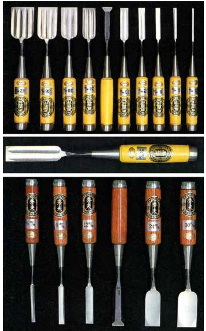
► Különleges, korábban csak Japánban használt speciális vésők.

Az átlagosan 0,4–0,6 mm vastagságú rugalmas acélfűrészeket a faipar minden területén jól lehet használni.