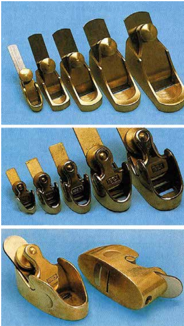
► Harminc éve a Herdim és az Ibex cég szállította ezeket a bronzból készült miniatűr csodákat. A legkisebb mindössze 18 mm hosszú, 5 mm szélességű késsel készül.