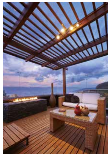
► A fa hangulata utánozhatatlan

A faanyag majd' minden tulajdonsága előnyére megváltozik. Megszűnik a gombásodása, mivel a gomba szokásos tápanyagai eltűntek az anyagból, vagy felismerhetetlenségig megváltoznak a gomba ízlelőbimbói számára. A kezelést