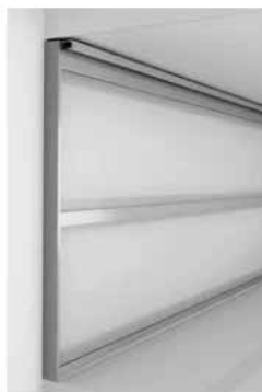
► Speciális aluprofil megoldások üveglap felszereléséhez

Csempe helyett a dekorozott forgácslap borítás harmonikus megoldás lehet. Az alkalmazhatóság korlátja, hogy nem minden munkalaphoz lehet dekort kapni. A dekor leragasztása a hordozófelületre szakértelmet és megfelelő méretű prést igényel. A túlságosan tagolt felület borítása nehézkes, sok vágást és élzárást tesz szükségessé. A munkalap és a falpanel közötti rést sziloplasztal kell tömíteni.