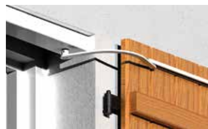
► WIBAT LINTEAU