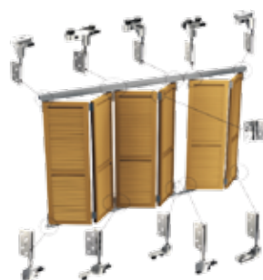
► WIN FOLD

Mivel a minőség és a biztonság a legfontosabb, a termékek megfelelnek mind a francia, mind a nemzetközi, európai normáknak. Kínálatukban megtalálhatóak toló, nyíló és harmonika zsalugáterek is, és kiemelten nagy hangsúlyt fektetnek az automatikák fejlesztésére is.