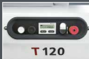
► A tengely motoros emelése és süllyesztése, illetve a tengelymagasság digitális kijelzése