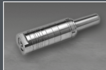
► Cserélhető MK 5 tengely többféle méretben