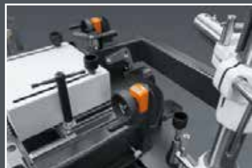
► Masszív, stabil vonalzó mikrobeállítással