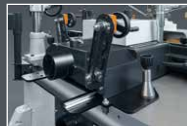
► A vonalzó vízszintes vezetőnkön mozog