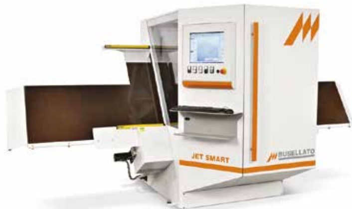
Busellato Jet Smart fűrő-maró automata korpuszok összeépítéséhez

élananyag fogadására, majd a felragasztott élananyagot az aggregátok automatán végvágják, hossz- és végkerekítették, él- és lapzittingelték, végül polírozták. A Casadei 47-es a cég élzáró palettájának felső középkegóriáját képviseli, 8–60 mm panelvastagsággal és 0,4–3 mm vastag élannyal (opcionálisan 6 mm vastag élfával is) is könnyedén elboldogul 12–16 m/perc előtolás mellett.