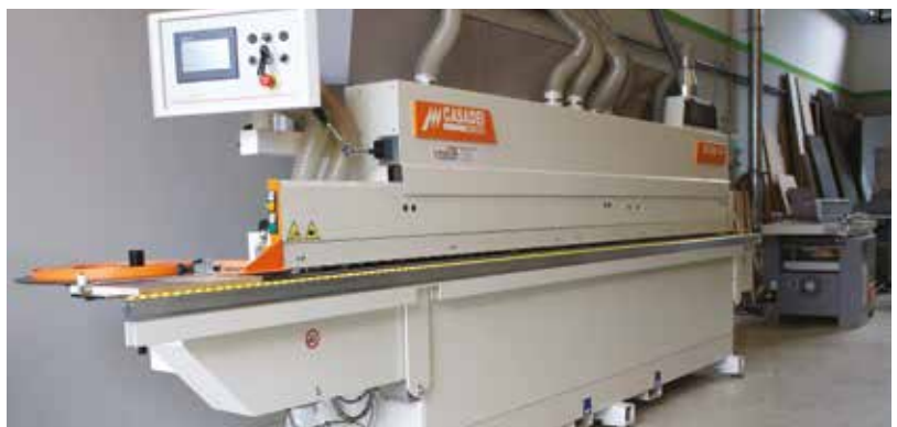
Élzárás akár nullfugával is

helytakarékos kialakítású CNC-berendezés, amelyet a nagy hatékonyság és a könnyű kezelhetőség jellemez. A sorozat legkisebb tagja X irányban 2486 mm, Y irányban 1255 mm megmunkálásra képes, míg a legnagyobb