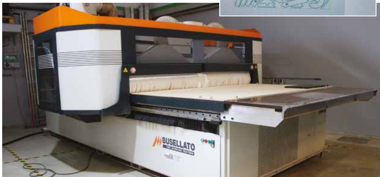
Egy kompakt, de nagy tudású CNC: Busellato Easy Jet