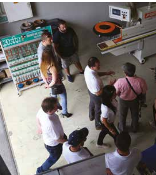
Sokan voltak kíváncsiak a gépek tudására, a részletekre

Az Easy Jet egy 30x30-as raszter kiosztású, fenolgyanta alapú asztallal rendelkezik, ami rugalmasan biztosítja a vákuumtér kialakítását a különböző méretű lapanyagok rögzítéséhez.