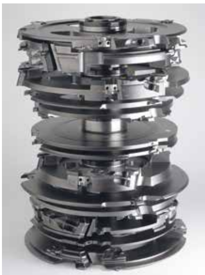
► 12 db fűzött szerszámcsoporthoz alkotja a teljes Garniga Multi Windows-t