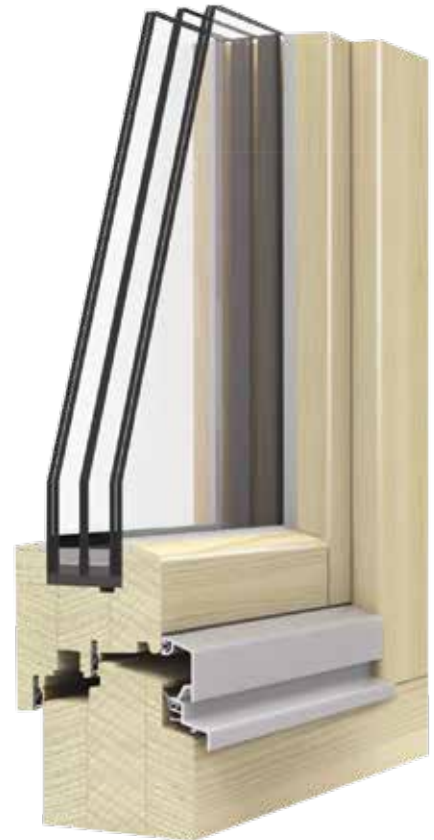
► Az alapszerszám alkalmas CE tanúsított IV 78 ablak gyártására

A 45 éve a szerszámipiacon jelen lévő Garniga nem bízta a véletlenre a termék sikerét, a rendszer alaptanúsított és a kapcsolódó szoftver segítségével érvényes CE-tanúsítás készíthető hozzá. A szoftverrel egyébként szabásjegyzék, üvegméret-kalkuláció is készíthető és hőátbocsátás is számítható.