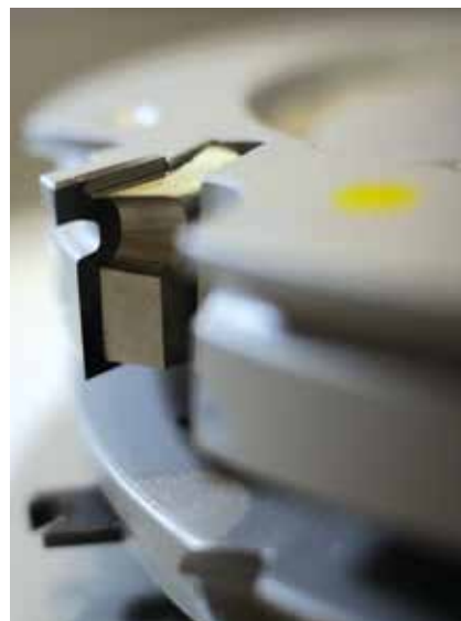
► A masszív csapozószerszám a keményfém munkaállal

A szerszámrendszer alapja, az IV 78 modul 12 db fűzött szerszámcsoporthoz áll, amely további szerszámelem vásárlásával bővíthető IV 92-es rendszerre, vagy az IV 78 fa-alu rendszerre. A szerszámok alumínium alaptesttel és keményfémlapok munkaelekkel dolgoznak, alacsony karbantartási igény mellett.