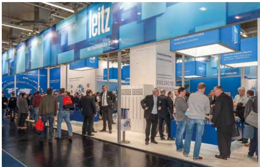
▶ A stand látogató száma önmagáért beszél. Valódi innovatív megoldásokat kínálnak partnereiknek