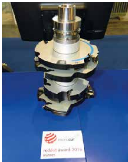
▶ A ProfilCut nem csak a kiállításon volt sikeres, a 2016-os reddot award díjat is megnyerte

A Fensterbau Frontale kiállítás „Power-paket”-szigetén a Leitz bemutatta azon szerszámrendszerait, melyek célja a feladatspecifikus megoldások bemutatása az ablak- és ajtógyártásban dolgozók számára. Itt voltak többek között láthatók azon innovációk, melyek a különböző szerszámok előnyeit ötvözik egy szerszámokban. Az újszerű fejlesztések célja a hatékonyság növelése, mely a magas megmunkálási minőséget, a nagy átbocsátó képességet és a gazdaságos szerszámhasználatot jelenti. Ezen új szerszámtechnológiák: a RipTec, az Integrál, a Hybrid. A nyolc modulból álló rendszer már nemcsak a nagyvállalatok igényeihez igazodik tökéletesen, hanem a kis- és középvállalkozások elvárásainak is megfelel. A könnyű kezelhetőség és a rugalmas gyártási lehetőség egyaránt a fejlesztések fő irányvonalai voltak. Az eredmény