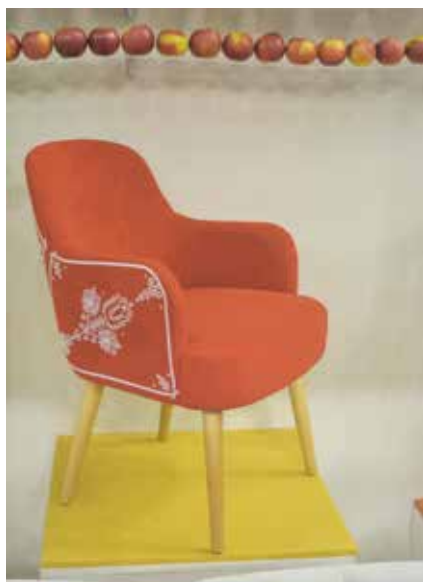
► Magyar motívumos kisfotel

hakiállításon azonban a vártnál kevésbé volt érzékelhető a bútorok jelenléte. A bútorok igazából csak a zárás környékén kezdtek megmutatkozni, amikor már ritkult a közönség. Ennek oka részben a standok átlagosan kis mérete volt, de nem tagadhatjuk, hogy bizony halvány volt a kínálat –kevés újdonság volt –, a szokott sablonok pedig nem vonzották a tekintetet, pedig ez itt egy válogatott mezőny. A valós hazai lakossági kereslet számára készülő bútorok sorsa a környékbeli lapszabászatban dől el egy negatív árversenyben. Nem véletlen, hogy a KIKA választéka kimondottan elegánsnak minősült ebben a környezetben, és az RS bútor kínálata sem lógott ki lefelé a sorból. A bútor a hagyományos gépészeti megoldások esetében még mindig gyakran csak csomagolás. A gépészeti egységek befogadására és részben leplezésére szolgált korábban, és ezt a funkcióját még az új trendek sem írják át azonnal. Így praktikusán még mindig divat a