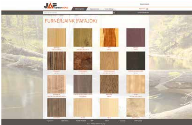
A több mint 300 fajta furnér természetesen fafajok szerint csoportosított és könnyen kereshető