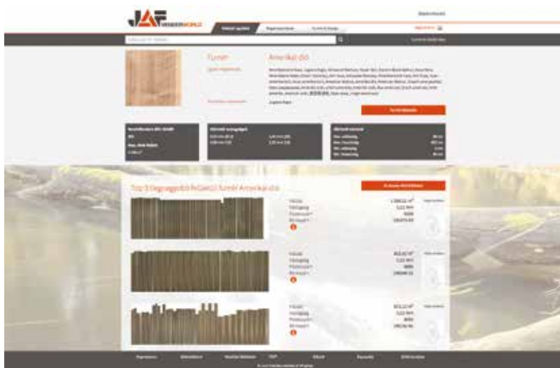
Egy konkrét furnértípusra kattintva jutunk a legfontosabb termékjellemzőkhöz és a furnérlistához

minőségi osztályban, 1,2 millió nagyfelbontású képen a nap 24 órájában bármikor böngészhető! Bizonyos fafajták esetén furnérok hatalmas mennyisége miatt jól jön a részletes furnérkereső, ahol a legtöbb ezen termék esetén járatos paraméterre, minőségre lehet szűrni. Bizonyos furnérok esetében a választék rettenetesen nagy, például most szeptember elején amerikai dió 1022 rönk furnéranyaga tekinthető meg a weboldalon, ami tízezres nagyságrendű kötésszámot jelent. Itt bizony szükség van a hatékony szűrésre. Furnér paraméter oldalon a vastagságra, hosszúságra, felületi struktúrára, rajzolat karakterére lehet szűkíteni a kínálatot. A vásárlási lehetőségeket tekintve három ajánlat közül lehet választani. A „Teljes rönkben” kapcsoló bepipálásával azon rönkönkénti kötések lehet kiválasztani, amelyek egyben rönkönként vásárolhatóak csak meg, de természetesen van olyan kapcsoló is, ahol kötéseként vagy palettáról történik a vásárlás.