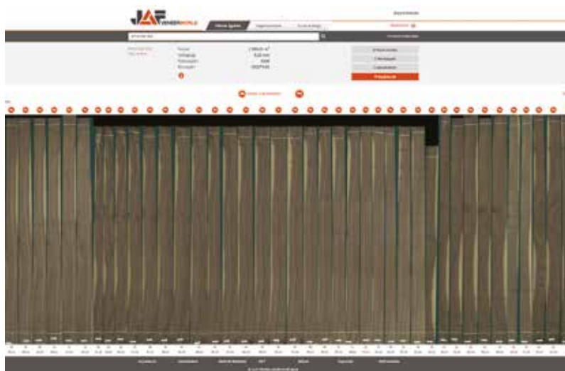
Az adott tétel kötése szépen sorakoznak egymás mellett, a kötésekre kattintva lehet megnézni az adott kötés rajzolatát.