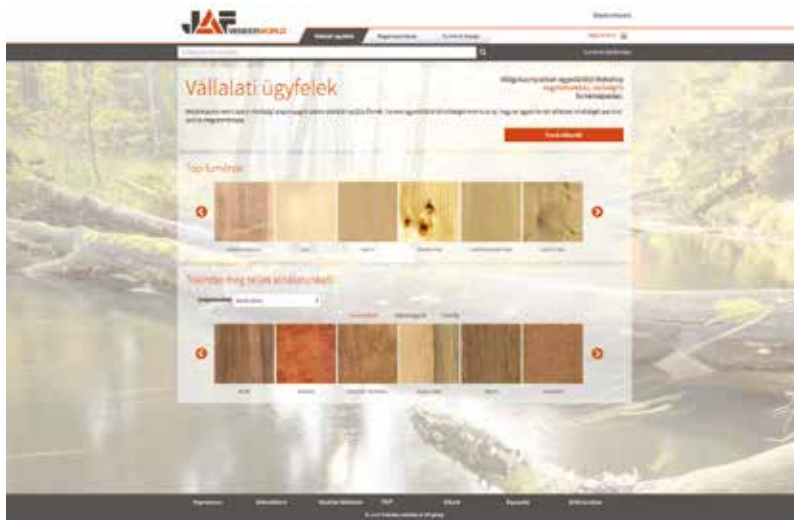
12 millió m 2 furnér, 190 konkrét fajfa található a JAFHolz új webáruházában