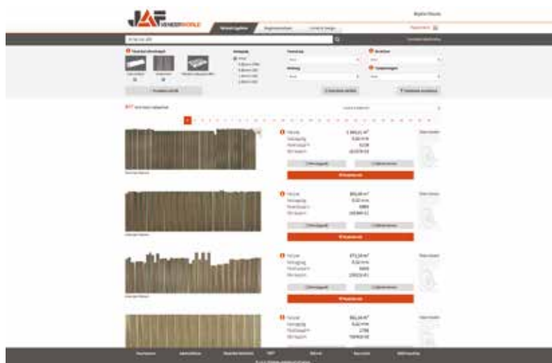
A vásárlási lehetőségeket tekintve három ajánlat közül lehet választani: teljes rönkben, kötésenként, vagy palettáról