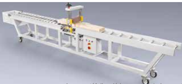
A ragasztófelhordó hengerek minden esetben csak a szükséges mennyiséget viszik fel a felületre.