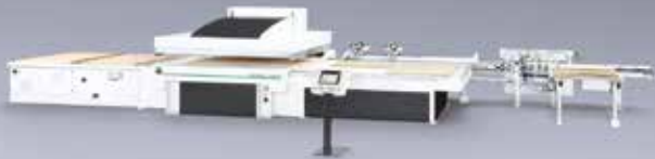
ProfiPress L II 2500 Comfort: a ragasztóprés high-end változata, mely már teljesen automatizált működésű.