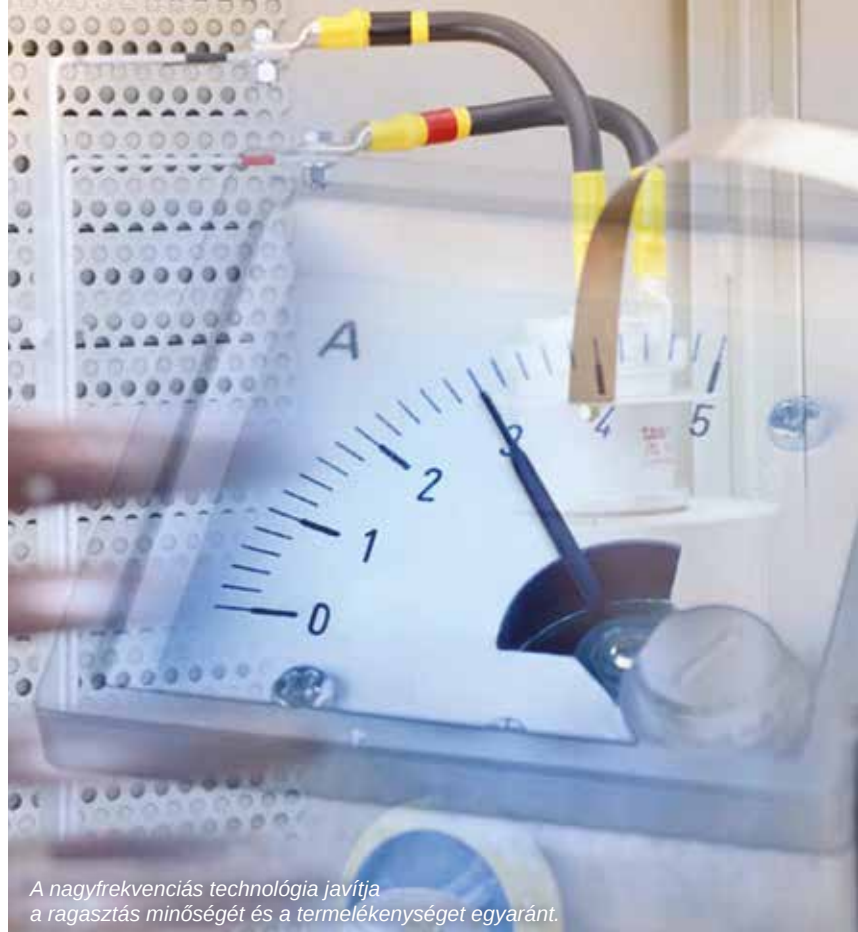
A nagyfrekvenciás technológia javítja a ragasztás minőségét és a termelékenységet egyaránt.

elszedő asztallal is rendelkezik. A kezelőnek csak az érintőképernyős kezelőegységen kell a megfelelő paraméterekre beállítani, a berendezés innentől fogva automatikusan működik. A prés a különböző ragasztási feladatokhoz pár paraméter változtatásával gyorsan átállítható.