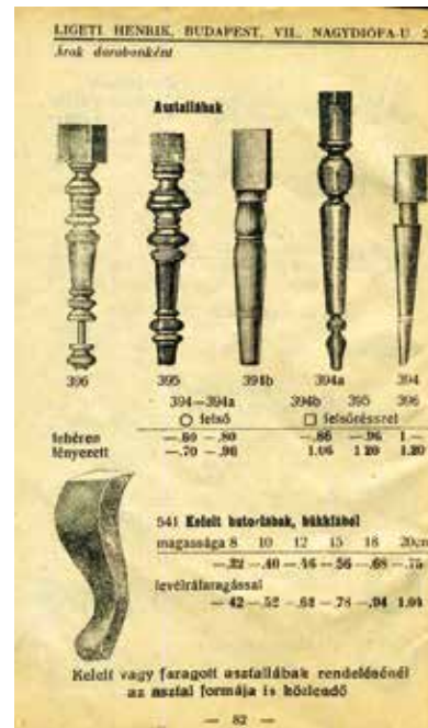
Esztergált és faragott bútorlábak

A húszas évek közepétől lassan, majd egyre nagyobb területet lefedve itt is megjelenik a műanyag. Elsősorban a fogantyúk, húzógombok látható részein találunk színes műszaru vagy celluloid műanyagot. A szakmatörténettel foglalkozó gyűjtők elsősorban szerszámokra specializálják magukat, de a korabeli szakirodalom, katalógusok, szakkönyvek legalább olyan izgalmas gyűjtési terület.