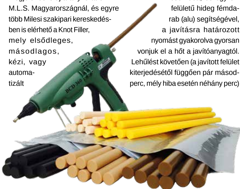
BCD360 Knot Filler

egy éles szerszámmal, ajánlottan BOGH kézi gyaluval távolítsuk el a javítóanyag-felesleget. Gyakorlatilag NINCS száradási idő, nincs térfogatvesztés, így repedezés, beesés sem keletkezik. A felület