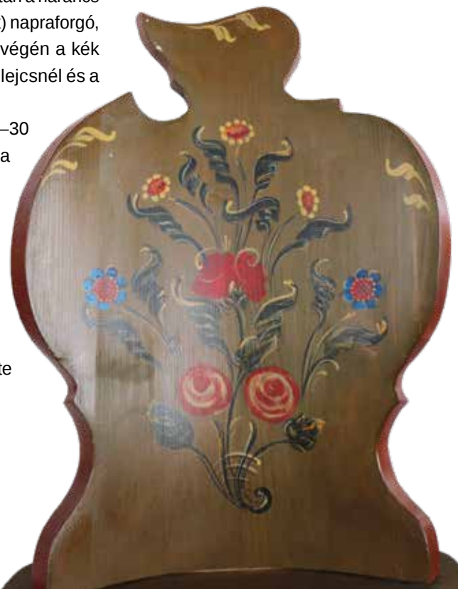
Torockói kontyos szék

Végül, ha megszáradt egy réteg, lehetőleg félfényes vagy matt, vizes bázisú akrillakkal keni be, ezzel zárja le a felületet, és emeli ki még jobban a színeket. Külön felhívja a figyelmemet az ecset fontosságára. Nagyon fontos, hogy csak természetes alapanyagút használjunk, pl. mókus farkának a szőre, vagy a tehén fülében lévő szőr. Vágni kell a végét, kihegyezni tűecsetnél, vagy ferdén levágni a levél festéséhez. Van egy különleges ecsete, Japánból kapta 15 éve, de azóta se tud ilyen jót beszerezni, az is ferdén van levágva, de még ilyen kopottan is nagyon jól lehet vele leveleket festeni. A tűecset 1–1,5 mm-es, az alapozóecset 1–2 cm-es is lehet.