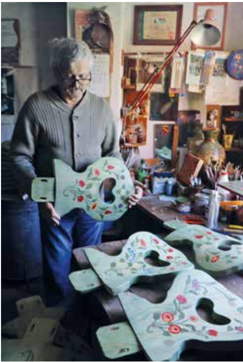
Minden széknek más a mintája

aki elkészítette volna, így kénytelen volt megtanulni ezeknek a bútoroknak a készítését is. Megtapasztalta, hogy csak jó minőségű, legalább 3 éven át természetes úton száradt lucfenyőből érdemes dolgozni. Ez a garanciája a jó minőségű terméknek. Szigorúan be kell tartani a szabályokat, az arányokat, amit a régi bútorok lemásolásával tanult meg.