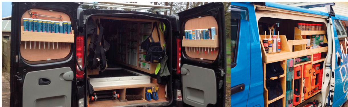
Variációk az okos helykihasználásra. Szerszámokat és kisebb bútorokat szállítóknak ideális megoldás

és. Ezért azt tanácsolom minden leendő vásárlónak, hogy előbb a felépítménygyártóval konzultáljon,