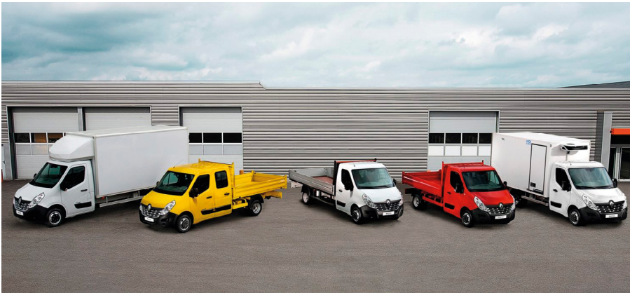
Olyan típusokat vizsgálgassunk, melyek megfelelő választ adnak munkáink kérdéseire

ségesek. Van a standard kabin, ami két ülést foglal magában, és plusz az ülések mögött egy kis tárolóterületet. Van az úgynevezett hosszabb „cab” kabin, ahol van egy második ülésor, azonban ennek az a hátránya, hogy úgy érezhetjük, az előttünk ülőnek a hátán ülünk, és nem is kényelmesen. A harmadik típus a duplafülkés megoldás, itt már a jól megszokott 2 soros ülések vannak, minden oldalról ajtóval. Ezt a megoldást akkor a legész- szerűbb választani, ha az autónkat minden téren használjuk, esetleg családostok vagyunk, mivel ebben a változatban egy 4 fős család kényelmesen tud bárhova utazni.