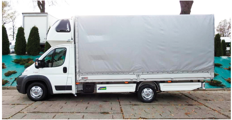
A ponyvás felépítmény egyik nagy előnye, hogy oldalról is pakolható

Az ügyvezető szerint a válság elmúltával érezhető egy emelkedő tendencia a megrendelések számában, megtorpanásokkal ugyan,