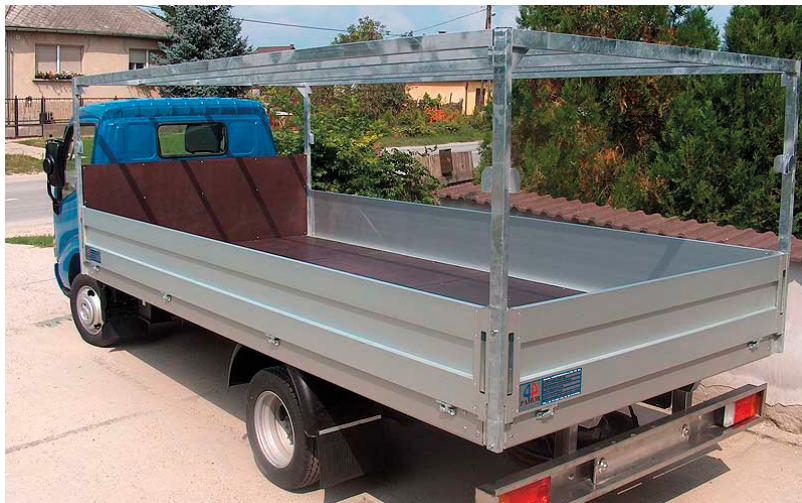
Ha a vevő tudja, hogy mit és hogyan akar szállítani, egyáltalán mire akarja használni a felépítményt, akkor a kivitelező ennek megfelelően gyártja azt

–Másfajta felépítményt javasolunk egy asztalosnak, egy villanyszerelő brigádnak, esetleg egy építőipari cégnek. Ezért, és a