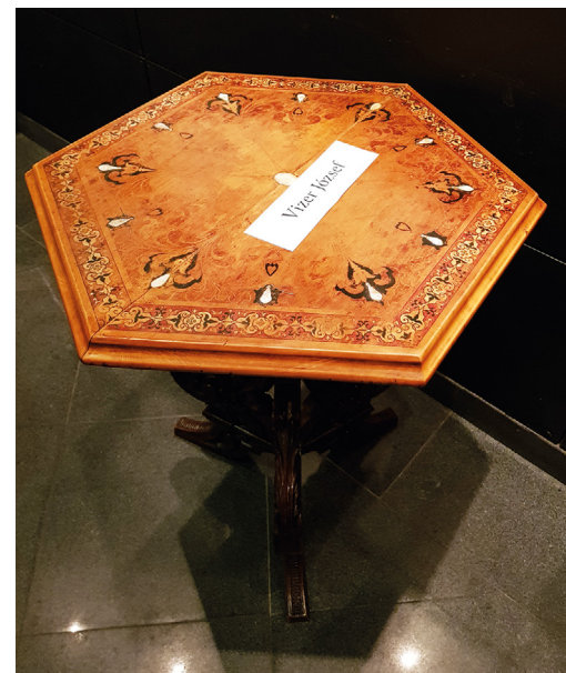
A mester egyik munkája