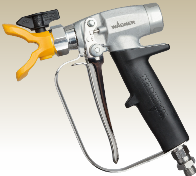
A Wagner 2K-s fújoberendezése elektronikus keverőrendszerrel