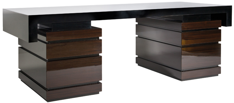
Nagy igénybevételnek kitett felület