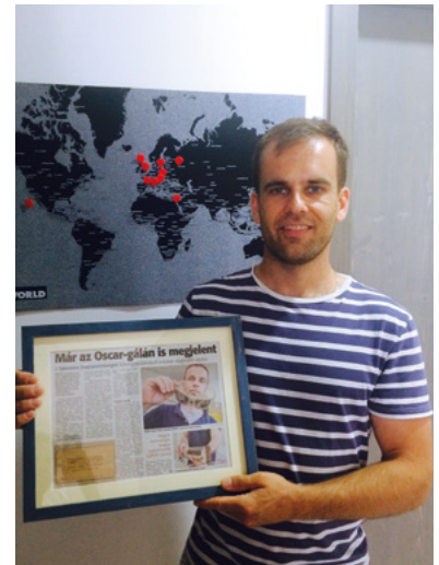
Munkái világszerte ismertek