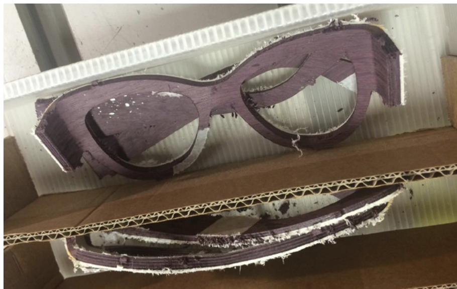
Keretek a munkafolyamat közben

– Kezdetben az interneten keresgettem, és a számomra izgalmasnak