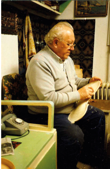
Télen a konyha sarka volt a műhely

egyéb anyagokkal nagyszerűen bánt. Ismerősei csodájára jártak a pici szorítóknak, gyalucskáknak, vésőknek, egyedi mintázású bor-szeszégővel melegített kávahajlító készülékének.