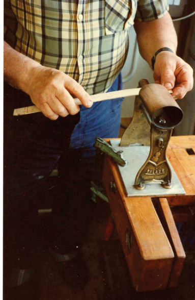
Saját készítésű kávahajlító

mára, hogy minden hegedű egy picit eltért a másiktól. Betartva a szakma szabályait elégítette ki az egyediségre való törekvés vágyát. Az újpesti Klára utcai családi ház vasúti sínekre néző kertjében, a ház