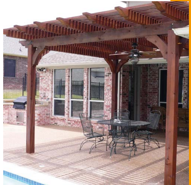
A pergola árnyékolásra alkalmas

a háló színe standard szürke, az alumíniumprofilok színválasztéka széles: a RAL színskála alapján fúj, illetve fóliás kivitelben is elérhetőek. A fix szúnyogháló tulajdonságait különösebben nem kell ecsetelni. Telepíthető fakeretre, de itt is elérhetőek az extrudált alumínium profilkeretek, amelyek bármilyen RAL-színre színterézhetőek. Előnye, hogy bármilyen egyedi alakzat készíthető, és árban ez a legkedvezőbb megoldás. Hátránya, hogy nem nyitható, de zsanéros keretre szerelve ez is áthidalható.