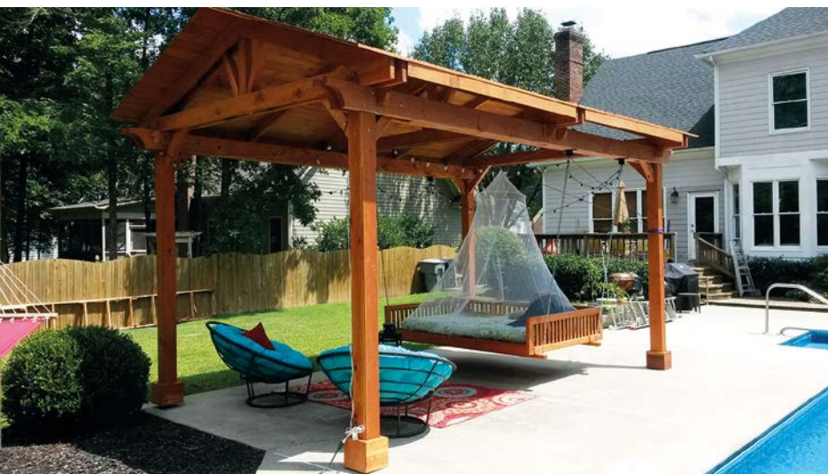
Az ún. daybed kerti pihenő ágygal