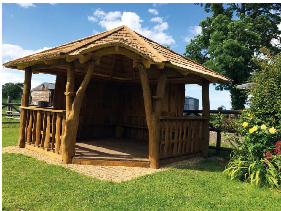
Rusztikus száletli rönkfából

Kerti kiülő, daybed, pavilon, filagória, pergola... Több esetben ködösek, esetleg ismeretlenek ezek a kifejezések. A közös bennük, hogy mindegyik külső lakókörnyezetben foglal helyet, és jellemzően a szabadidő eltöltésére kínálózik. Most, hogy tavaszodik, és előttünk a nyár,