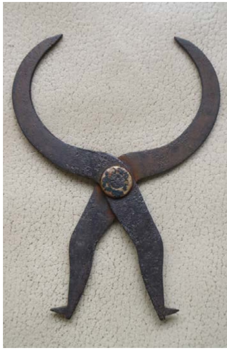
A szerző bolhapiaci lelete