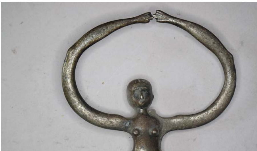
Minden részletében kidolgozott mérőkörző

sabb kialakításúaknál a fémlemezbe női harisnyatartót, fehérneműt is gravíroztak. A legbonyolultabbak teljes női alakot, feltartott kezű táncosnőt mintáztak. Ezek az eszközök jellemzően lemezből készültek, középen szegecselve. Mívesebb esetben kovácsolták az alkatrészeket. A leglátványosabb darabokat részletesen megmintázták, majd részből vagy bronzból leöntötték őket. Cikkem apropóját az adta, hogy néhány éve az egyik