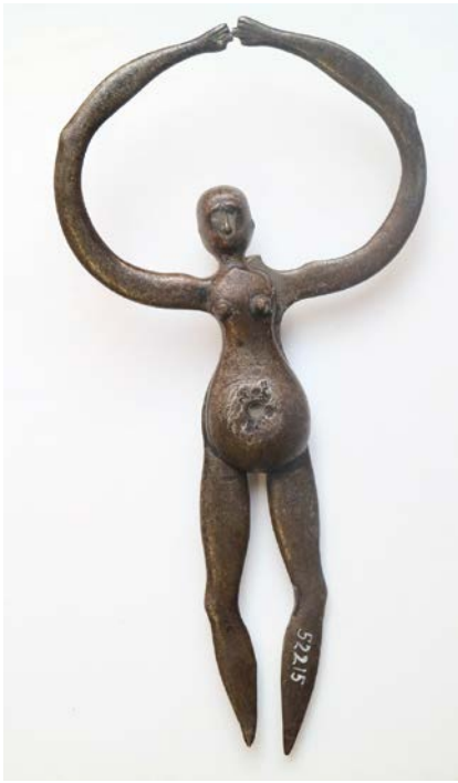
A bronzból öntött nőalak