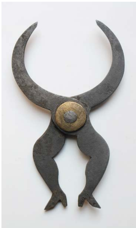
A Néprajzi Múzeum egyik Táncmestere

mot, egyházi szimbólumokat, illetve geometrikus, növényi vagy emberábrázolásokat. Minden nagyobb európai országban kialakultak a jellegzetes szerszám típusok – formák és díszítésvilág.