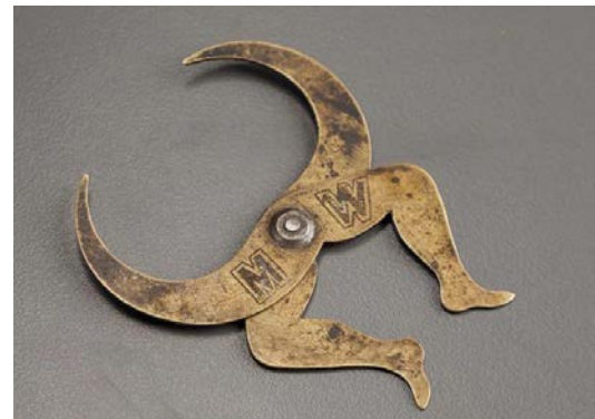
Aukciós honlap egy tétele

finom famegmunkáláshoz szokott szobrászok, asztalosok és bognárok. Ezek a céhekbe tömörült mesterek azon túl, hogy a legjobban használható és egyre kifinomultabb szerszámokat igyekeztek gyártani, természetesen még büszkéek is voltak munkájukra. Így az 1500-as évek végén megjelentek a mesterjegyek, ami alapján lehetett tudni, hogy ki készítette azt. (Korai marketing.) A szerszámok fejlődése, formai kialakítása a 17–18. századra érte el a használhatóság legmagasabb fokát. Az 1600-as évek második felétől kezdve egyre több fém- és faszerszámon találunk jelzéseket. Többnyire a tulajdonos monogramját, esetleg teljes nevét, évszám-