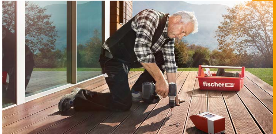
Fischer TERRADEC teraszrögzítő elemek

A horonnyal ellátott teraszburkoló anyagok esetében a rögzítőelem a szomszédos burkoló padlólapok hor-