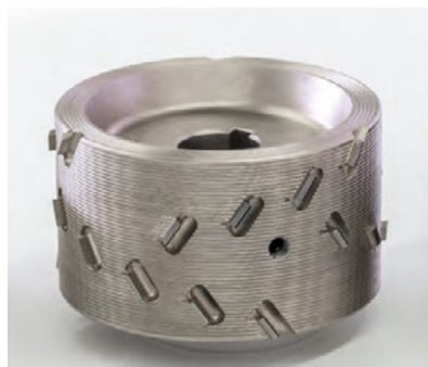
Leuco Diamax airFace

A legtöbb zajt a turbulencia okozza a szárny hátsó szélén. A „bagolyszárny” koncepció a hullámos szárnyvégek által elsimítja a légáramot, és ezáltal csökkenti a zajt, ami egy hangmentes közeli repülést tesz lehetővé és nincs negatív hatással az aerodinamikára.