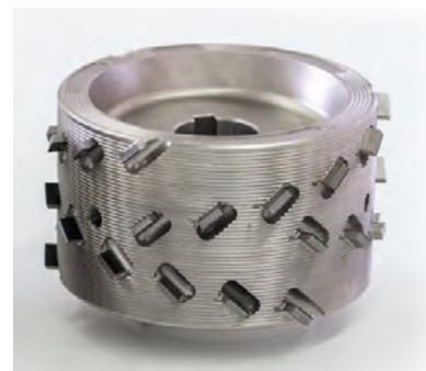
Leuco Diarex airFace